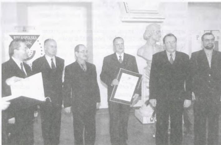
Wręczenie Certyfikatu przez przedstawicieli Instytutu jakości.

W ogólnopolskim konkursie "Przyjaźni Środowisku" pod patronatem Prezydenta RP i Ministra Środowiska KOM-LUB uzyskał nominację do finału w kategorii "Firma Przyjazna