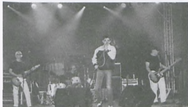
Piasek wystąpił razem z zespołem.

W sobotę koncert Piaska, a w niedzielę gwiazdą był zespół Sexbomba i Janusz Laskowski.