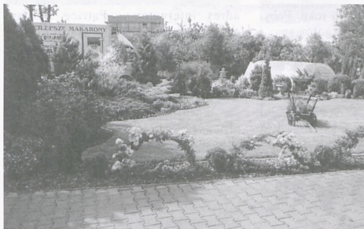
fotografie na stronie Cezary Biderman