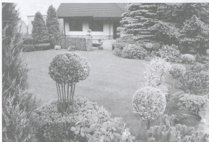
Konkursowe ogrody Lubońskie