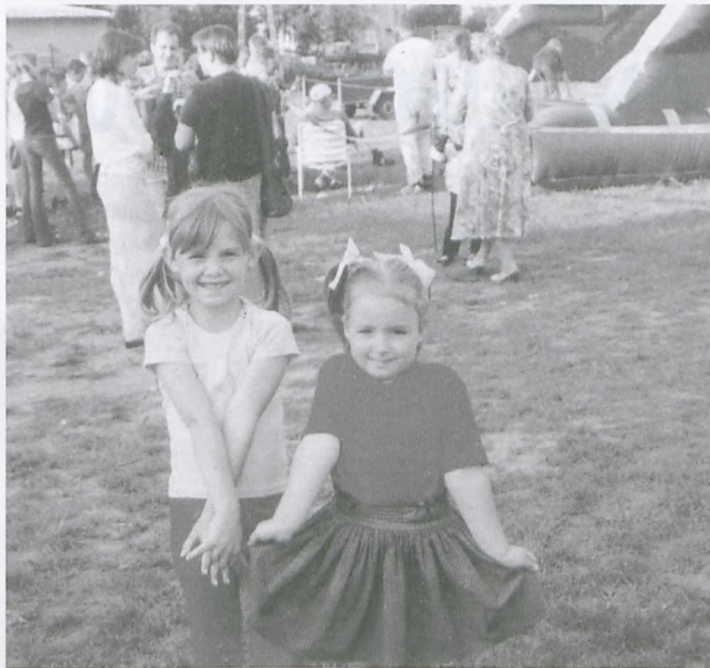
Festyn rodzinny z okazji Dnia Matki