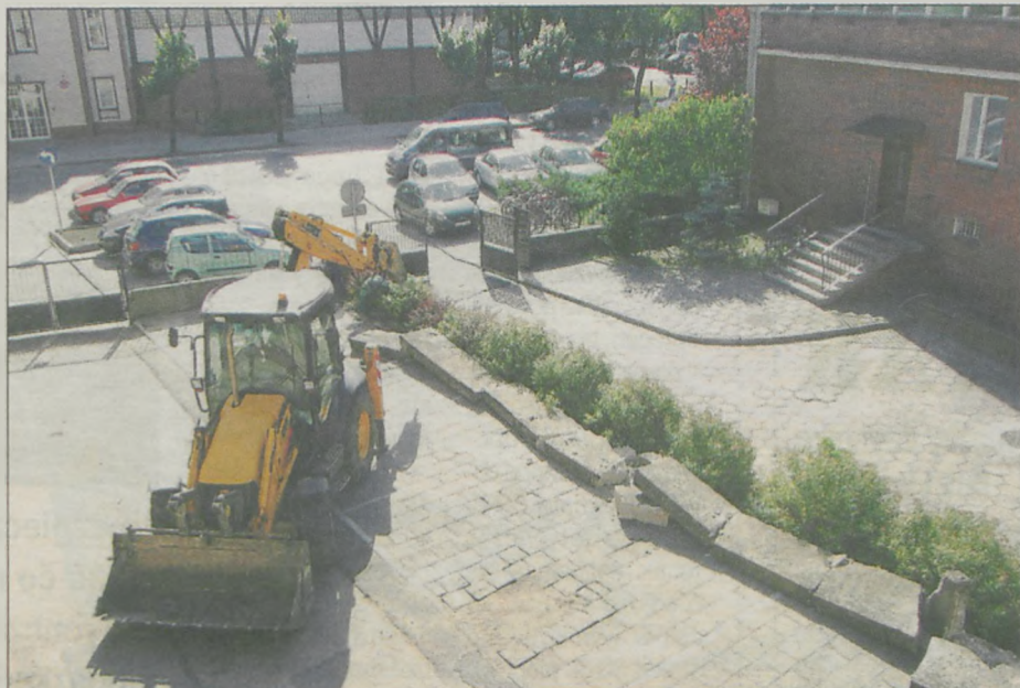
W minioną środę pracownicy interwencyjny wyburzyli murek oddzielający place, na których wybudowany ma zostać parking