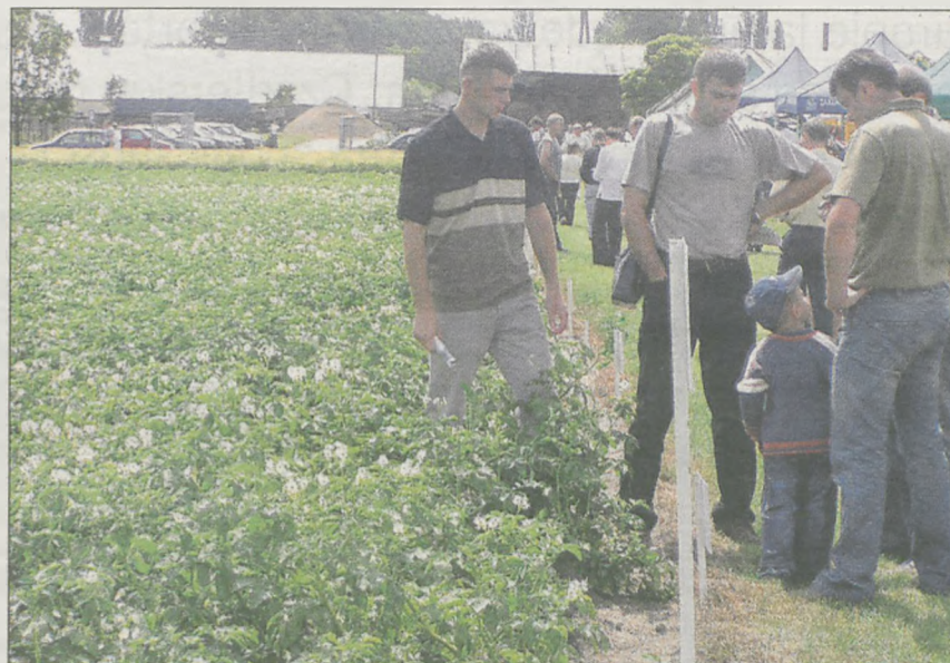
130 odmian roślin uprawnych będą mogli obejrzeć rolnicy na poletkach wystawowych tegorocznych Marszewskich Dni Pola

Tegoroczne Marszewskie Dni Pola odbędą się 14 i 15 czerwca. Rolnicy na poletkach doświadczalnych będą mogli obejrzeć 16 gatunków (130 odmian) roślin ozimych i jarych oraz zapoznać się z technologią ich uprawy. Informacji udzielać mają hodowcy, autorzy odmian oraz firmy produkujące środki ochrony roślin i nawozy, które zostały wykorzystane na prezentowanych poletkach. Będzie także można skorzystać z porad specjalistów Wielkopolskiego Ośrodka Doradztwa Rolniczego.