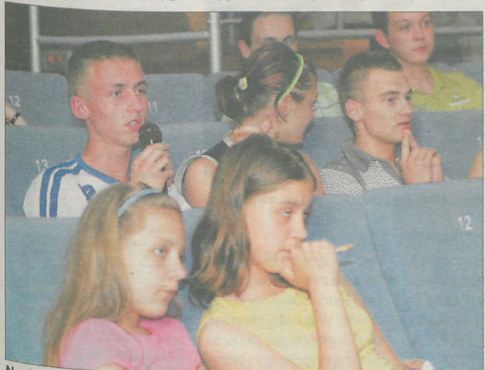
Na drugie konsultacje przyszła również młodzież