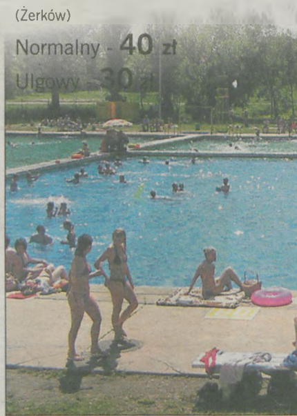
Żerkowskie baseny co roku przyciągają tłumy