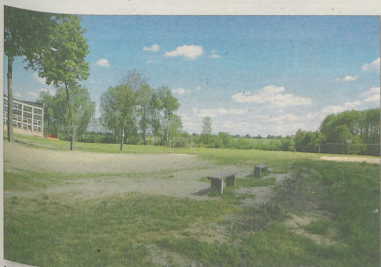
NA TYCH TERENACH miałyby powstać boiska ze sztuczną nawierzchnią, a w przyszłości być może cały kompleks wraz z bieżnią.

Bąk. - Ja mam do 15 po szóstej czas, żeby wniosek zanieść na pocztę, jak nie zdążę, będę musiała jechać do Poznania - prosi o przesunięcie przerwę. Chodzi o szybką dyskusję i przegłosowanie uchwały w sprawie zaciągnięcia kredytu pod budowę boiska ze sztucznej trawy w Chociczy. Uchwała ma być dołączona do wniosku o dofinansowanie inwestycji ze środków Funduszu Rozwoju Kultury Fizycznej. Część radnych jest zdziwiona, ponieważ na komisji projekt tej uchwały nie był dyskutowany. Trafił do porządku obrad przed sesją.