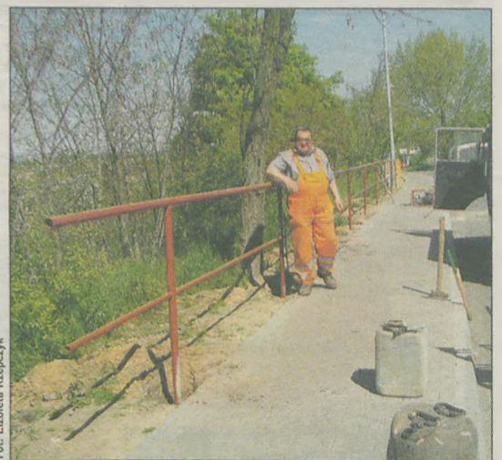
Fot. Elżbieta Rzepczyk