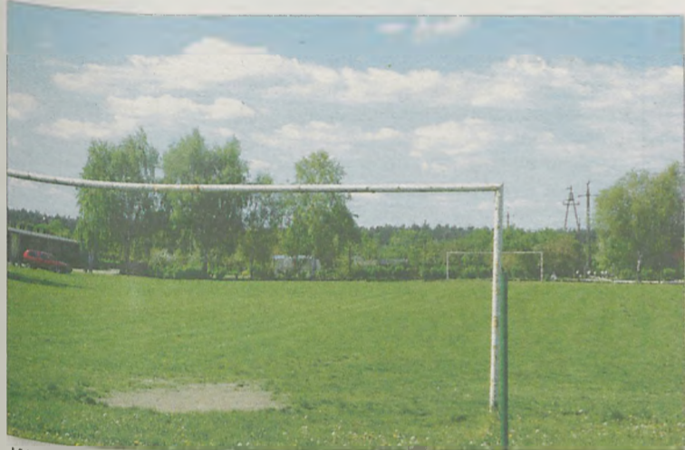
JAK NA RAZIE prawie wszystkie zajęcia wf-u odbywają się na boisku należącym do wspólnoty mieszkaniowej.

Po pierwsze projekt był wprowadzany na ostatnią chwilę, a po drugie się zadłużamy. Prawie 600 tys. trzeba byłoby wyłożyć od razu, a kiedy pieniądze będą zwrócone, nie wiadomo. Przez ostatnie półtora roku naszej kadencji wiele rzeczy było włączanych do obrad na ostatnią chwilę. Otrzymując zawiadomienie na komisję, powinniśmy dostać projekty uchwał, żeby już móc dyskutować. To takie wszystko naciągane, że trzeba jechać szybko na pocztę, żeby wystąpić projekt. Nie tak to powinno być.