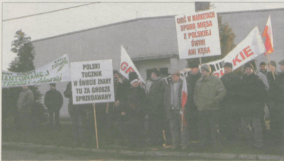
ROLNICY Z GOLINY z transparentami wyruszyli do Poznania

Rolnicy z Wielkopolski, a wśród nich również z powiatu jarocińskiego, protestowali pod Urzędem Wojewódzkim w Poznaniu. Pikiętą chcieli zwrócić uwagę na nieopłacalność produkcji trzody chlewnej.