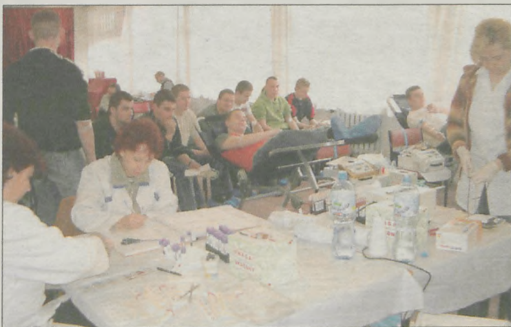
Oddana krew może być darowizną, którą mamy prawo odliczyć sobie od podatku.

Honorowi dawcy krwi mogą, rozliczając się z fiskusem, odliczyć sobie jako darowiznę oddaną przez siebie krew. Do skorzystania z ulgi uprawnione są osoby, które oddały bezpłatnie krew i zostały zarejestrowane w stacji krwiodawstwa. Odliczeniu podlega faktycznie oddana ilość krwi przemnożona przez kwotę ekwiwalentu. Jeden litr krwi jest wyceniany na 130 zł. Krwiodawca może oddać 2,7 litra rocznie, więc będzie mógł odliczyć od dochodu maksymalnie 351 zł. Ważne tylko, by zadbał o zaświadczenie z centrum krwiodawstwa wydawane na koniec roku.