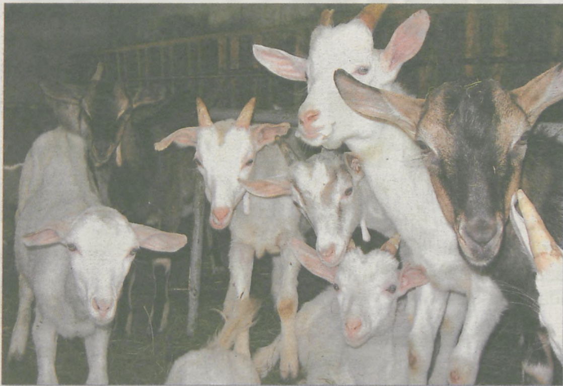
URODZONE PO 31 GRUDNIA niektóre kozy będą musiały być specjalnie oznakowane

Po znakowaniu bydła i trzody, przyszła kolej na owce i kozy. Wszystkie te zwierzęta, które urodziły się po 31 grudnia 2007 r. i są przeznaczone do handlu wewnątrzspółnotowego (sprzedaż z Polski do innych krajów UE) obowiązkowo muszą być oznakowane elektronicznym identyfikatorem. Obowiązek ich znakowania tzw. chipami wynika ze specjalnego rozporządzenia Rady Europejskiej. Zarówno kozy, jak i owce muszą być oznakowane dwoma kolczykami, w tym jednym zawierającym elektroniczny identyfikator (na prawym uchu). Zwykły kolczyk musi być umieszczony w lewym uchu. Zwierzęta przeznaczone do obrotu krajowego znakuje się poprzez założenie dwóch kolczyków zwykłych.