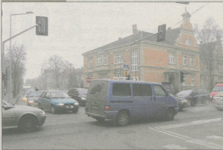
Skrzyżowanie ul. Kościuszki z al. Niepodległości