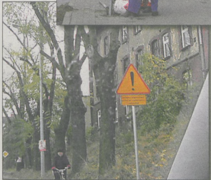
Na ulicach wjazdowych pojawiły się tablice informujące o zmianie organizacji ruchu. Sęk w tym, że są niewielkich rozmiarów i mało widoczne.