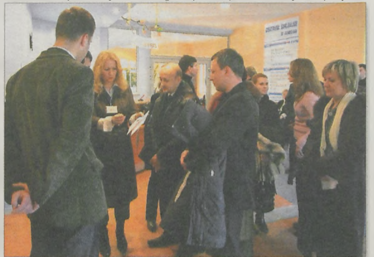
GOŚCIE Z UKRAINY w czasie wizyty w Centrum Socjalnym w Jarocinie

darczą w regionie. Członkowie delegacji odwiedzili także Powiatowe Centrum Pomocy Rodzinie, które mieści się w wyremontowanym przez powiat budynku przy ul.