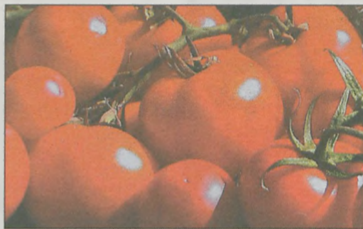
POMIDORY - chronią organizm przed rakotwórczymi zanieczyszczeniami środowiska. Ryzyko powstania raka prostaty u mężczyzn spożywających w tygodniu 10 pomidorów zmniejsza się o 45 %