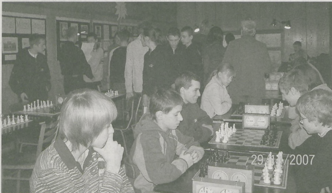
MISTRZOWIE POWIATU JAROCIŃSKIEGO w szachach w kategorii gimnazjów - drużyna Gimnazjum nr 1 w Jarocinie

Szachowe drużyny z Gimnazjum nr 1 w Jarocinie i Gimnazjum w Woli Książęcej reprezentować będą powiat jarociński w Drużynowych Mistrzostwach Wielkopolski w szachach.