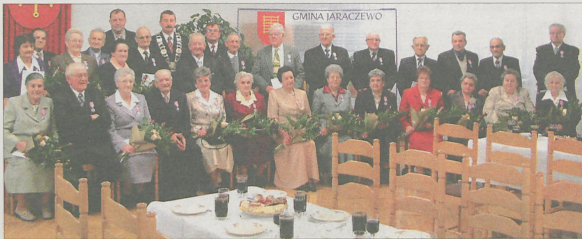
PAMIĄTKOWE ZDJĘCIE PAR, które obchodziły złote gody z władzami gminy