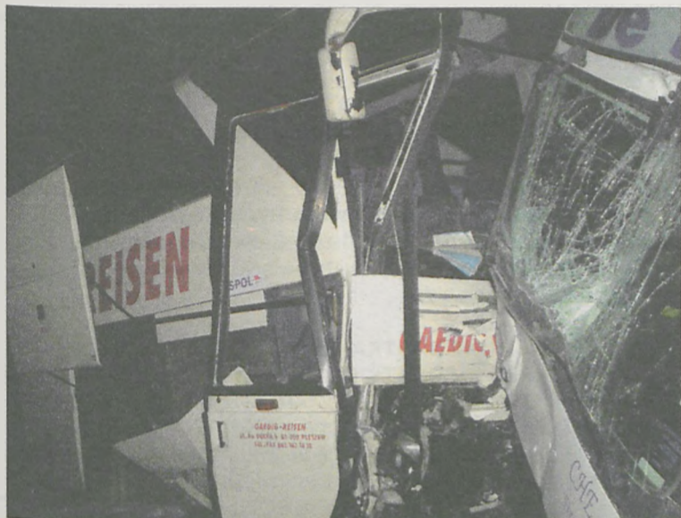
AUTOBUS PRZEWOŻĄCY 31 OSÓB zderzył się z ciężarówką

volkswagen golf. Jego kierowca nie przeżył zderzenia z tirem.