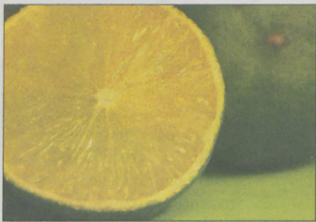
CYTRUSY - bogate są w związki antyrakowe

Wybierając posiłek, przekąskę bądź napój podejmujemy decyzję, która ma pozytywny lub negatywny wpływ na nasz organizm. Nie każdy mężczyzna wie, że jedząc często pomidory zmniejsza ryzyko wystąpienia raka prostaty. Gdy zaś sięga po piwo w dużych ilościach, ma większe szanse zachorowania na nowotwór trzustki.