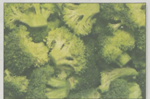
BROKUŁY i pokrewne im warzywa - są skuteczne w walce z nowotworami płuc i jelita grubego