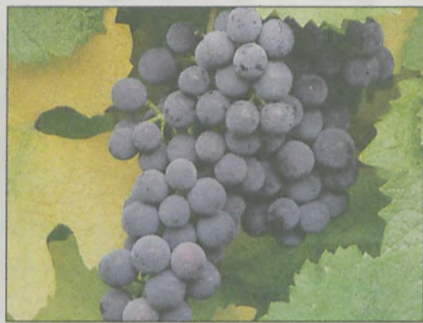
WINOGRONA, a zwłaszcza ich skórka - powstrzymuje rozwój raka