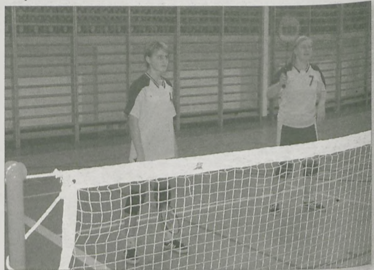
REPREZENTANTKI GIMNAZJUM z Chociczy