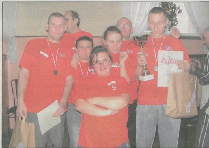
W KLASYFIKACJI DRUŻYNOWEJ najlepsi byli gospodarze czyli Środowiskowy Dom Samopomocy z Jarocina

W Turnieju Tenisa Stołowego, który już po raz szósty zorganizował Środowiskowy Dom Samopomocy w Jarocinie, uczestniczyło 35 zawodników z sześciu ośrodków z Jarocina, Zakrzewa, Noskowa i Pleszewa. Zmagania odbywały się jednocześnie na czterech stołach ustawionych w sali Cechu Rzemiosł Różnych. W przerwach pomiędzy kolejnymi etapami rywalizacji uczestnicy zajęć w jarocińskim ŚDS-ie pomagali w zorganizowaniu posiłków dla wszystkich uczestników.