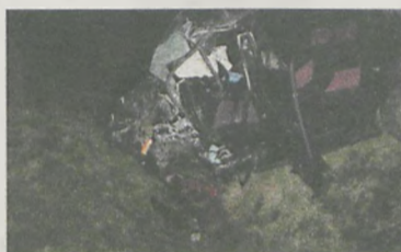
Za udostępnienie zdjęć dziękuję strażakom z Komendy Powiatowej Państwowej Straży Pożarnej w Jarocinie