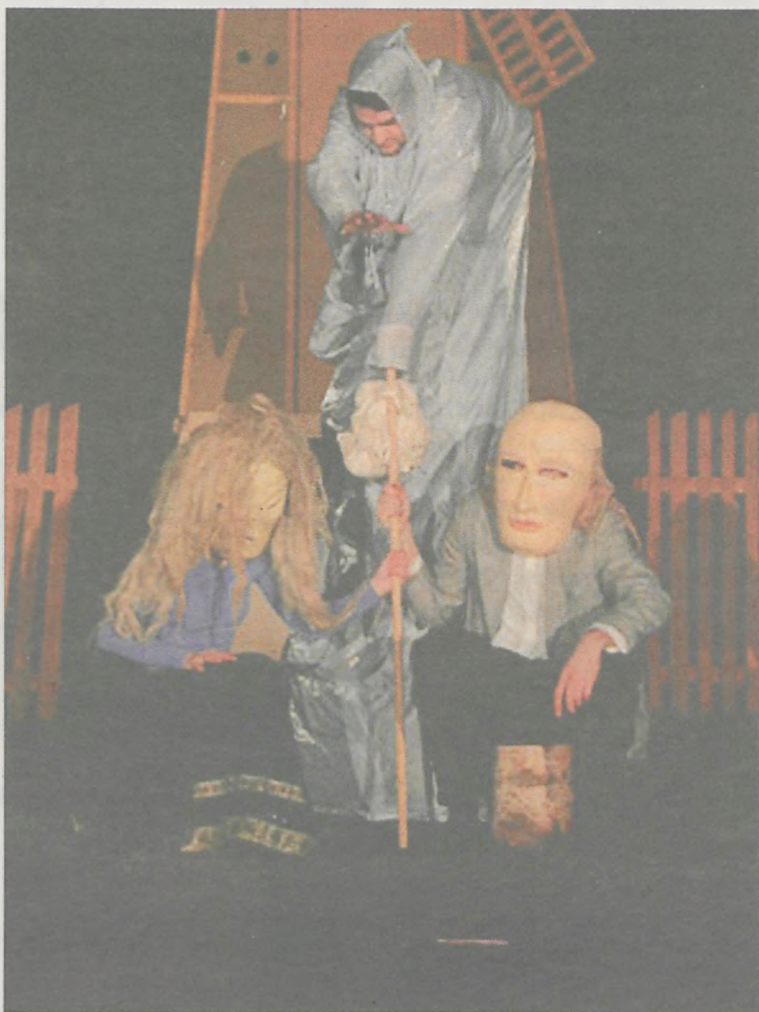
TEATR CZTERY ŻYWIÓŁY

O 17-tej rozpocznie się koncert w kościele św. Marcina. Na