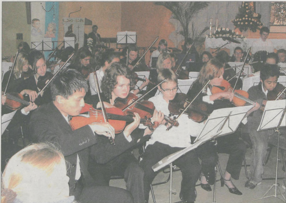
UTWÓR POŚWIĘCONY JAROCINOWI wykonali wspólnie młodzi muzycy z Jarocina i Veldhoven