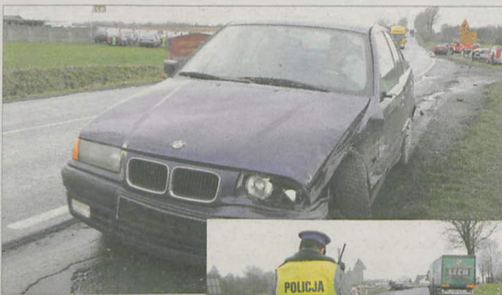
BMW uderzyło w volkswagena polo