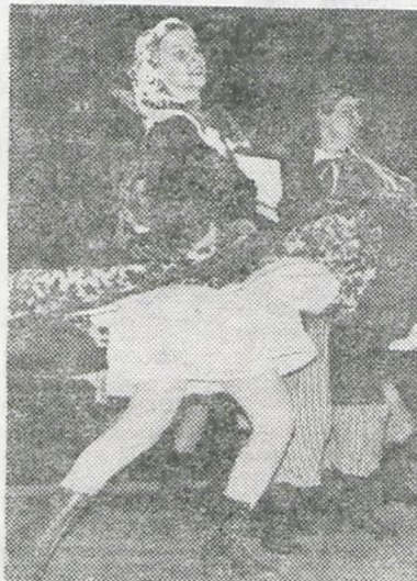
Tańczący — „Wielkopolska”

W przeddzień święta klasy robotniczej, 30 kwietnia, w sali widowiskowej Odlewni Żeliwa odbyła się uroczysta miejsko-gminna akademii 1-majowa. W części arty-