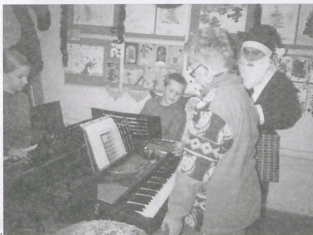
Św. Mikołaj w Ośrodku Kultury

Finał Wielkiej Orkiestry Świątecznej Pomocy odbędzie się jak w całym kraju 13 stycznia 2002r. Koncert finałowy połączony z dyskoteką dla wolontariuszy odbędzie się w Gimnazjum nr 2. W Luboniu na ulice tego dnia wyjdzie z puszkami 199 wolontariuszy zaopatrzonych w oryginalne identyfikatory. Tegoroczna zbiórka przeznaczona jest dla ratowania życia dzieci z wadami wrodzonymi, a w szczególności leczenia operacyjnego noworodków i niemowląt.