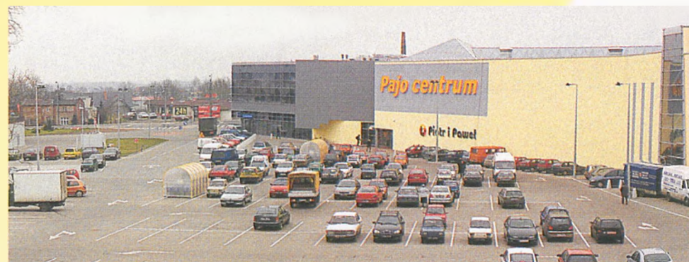
Bezpłatny dodatek do „Więści Lubońskich” - wydawca: „Forum Lubońskie” - opracowanie: Michał Schmidt

Firma BLANC Centrum Handlowe, Główny Luboń, ul. Paderewskiego 14 tel./fax 810-6-19