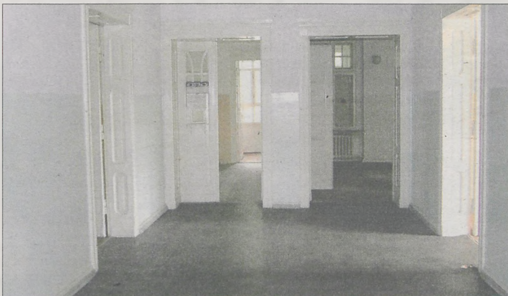
Wszystkie drzwi do pomieszczeń wewnątrz budynku są pootwierane na oścież

Jedno z wejść do budynku od pewnego czasu było otwarte. - Trudno, żeby tam cały czas był dozorca - tłumaczy starosta i dodaje: - Jeżeli ktoś się będzie chciał włamać do budynku, to włamie się nawet do najbardziej strzeżonego.