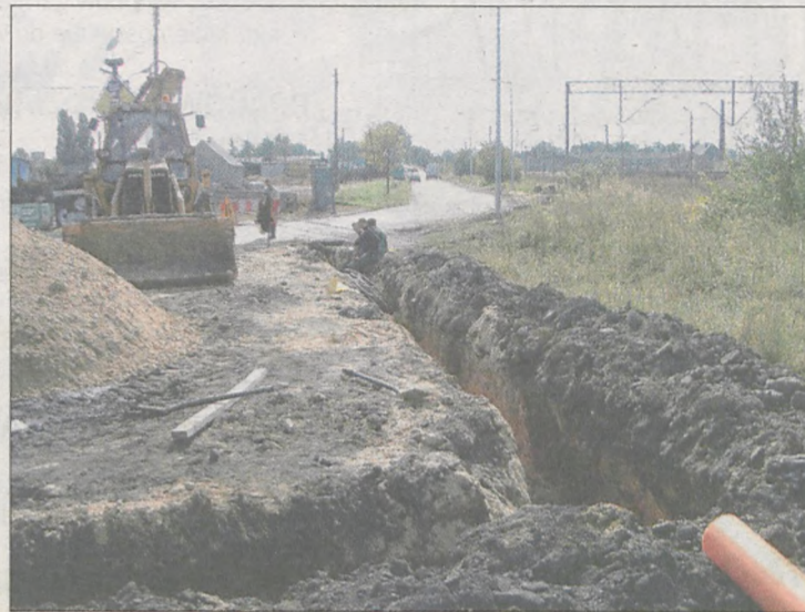
Nowe oświetlenie uliczne, chodnik i nawierzchnia na ulicy Węglowej będą już wkrótce gotowe. Inwestycja powstaje dzięki porozumieniu gminy Jarocin, powiatu i spółki PEC

Gminna spółka Przedsiębiorstwo Energetyki Ciepłej w Jarocinie prowadzi na ulicy Węglowej budowę oświetlenia i sieci gazowej. W związku z robotami wykonawca zobowiązał się na własny koszt odtworzyć chodnik - od ul. Powstańców Wlkp. do torów. Na tym samym odcinku powiat razem z gminą Jarocin zleca wykonanie na jezdni tak zwanego dywanika na zimno. - Nie przewidywaliśmy inwestycji na tej ulicy. Jednak w związku z dużym zakresem robót, który jest tam już wykonywany, nadarzyła się okazja, żeby ta droga, która jest zresztą ulicą