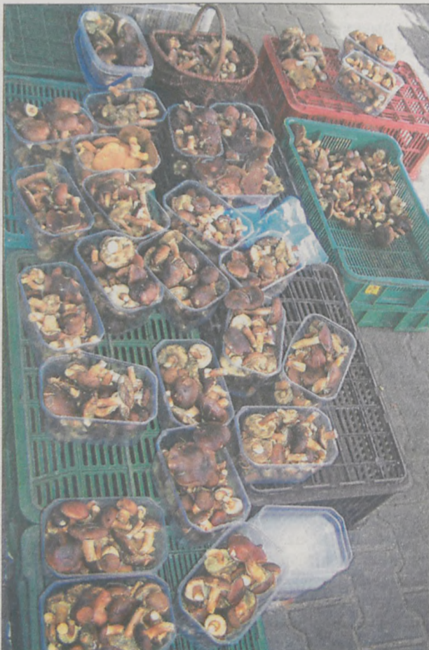
Za pojemnik pełen czarnych lebków na jarocińskim targowisku zapłacimy 5 zł.