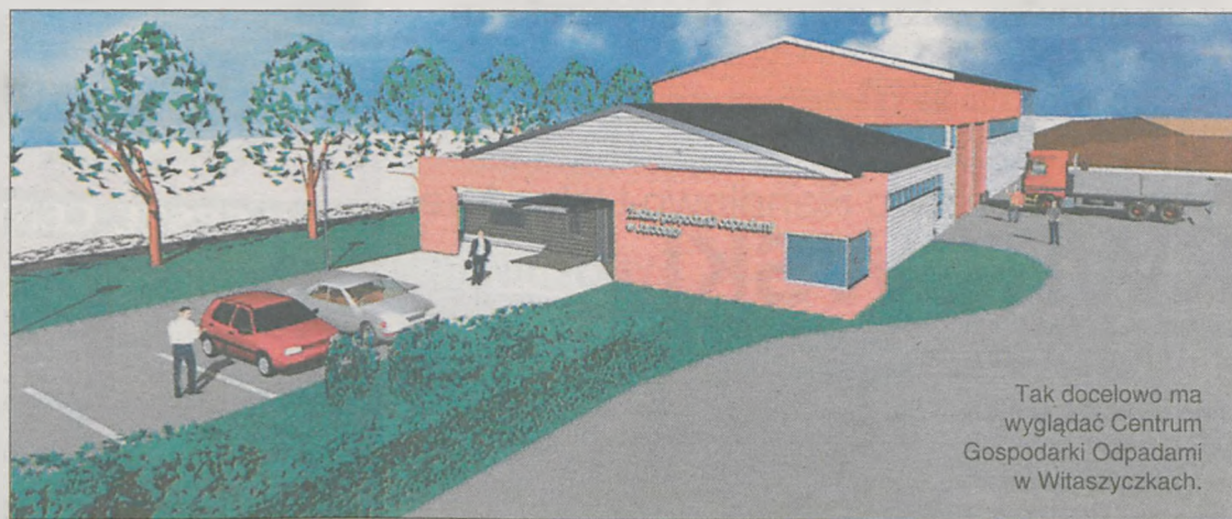
Tak docelowo ma wyglądać Centrum Gospodarki Odpadami w Witaszyczkach.

Gmina Gizatki jest kolejną po: Jaraczewie, Kotlinie, Nowym Mieście i Żerkowie, z którą jarociński samorząd zamierza współpracować w zakresie gospodarki odpadami. Stosowna uchwała ma zostać podjęta na wtorkowej sesji jarocińskiej rady miejskiej.