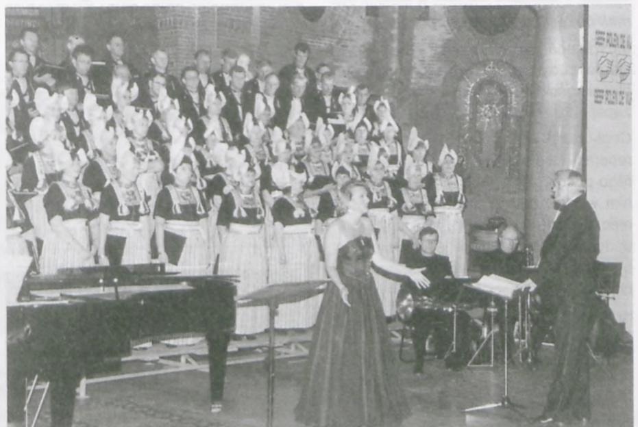
22 kwietnia 1994 roku Beverwijk świętuje 12,5 roku kontaktów z Wronkami. Program uświetnia występ znanego na całym świecie chóru opery z Volendam w kościele św. Agaty

W Beverwijk rozważa się możliwość wydania książki w języku niderlandzkim opisującej historię Wroniek po roku 1945.