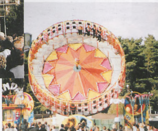
Pierwszy raz we Wronkach kręciła się taka karuzela... ▼