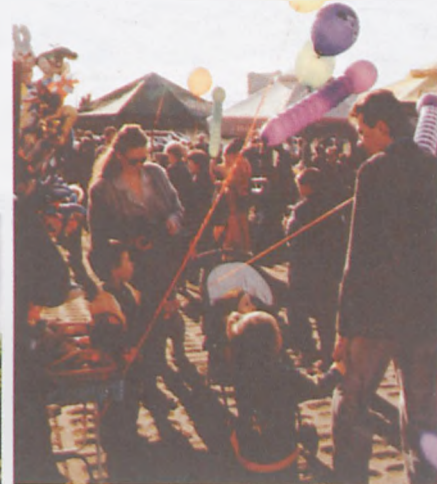
▲ Na niedzielnym festynie bawiły się całe rodziny - „było dla każdego coś miłego” (nawet lodówka do wygrania w loterii fantowej)