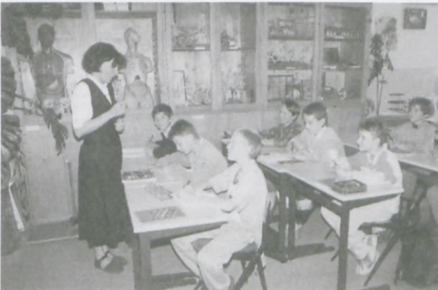
Holenderskie meble w jednej ze szkół we Wronkach - jeden z wielu darów przysyłanych przez Stowarzyszenie Pomocy Medycznej Umond Wronki

W tym roku ma miejsce osiemdziesiąty transport do Polski. Między innymi jest w nim bli-