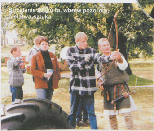
Strzelanie z łuku to, wbrew pozorom, niełatwa sztuka