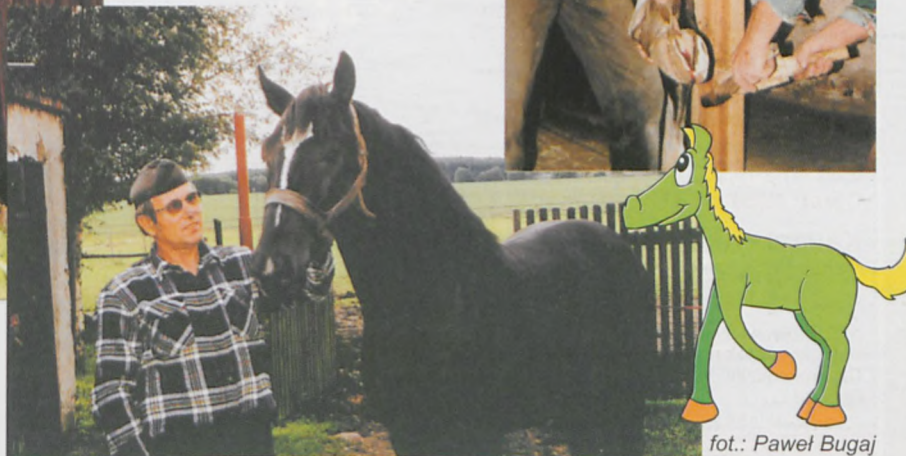
Stanisław Spychała i jego wychowanek - ogier Raj ▶