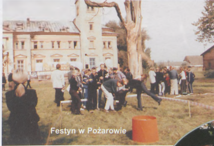
Festyn w Pożarowie

Słodycze, napoje, cukrową watę rozdawano wszystkim uczestnikom festynu ▶