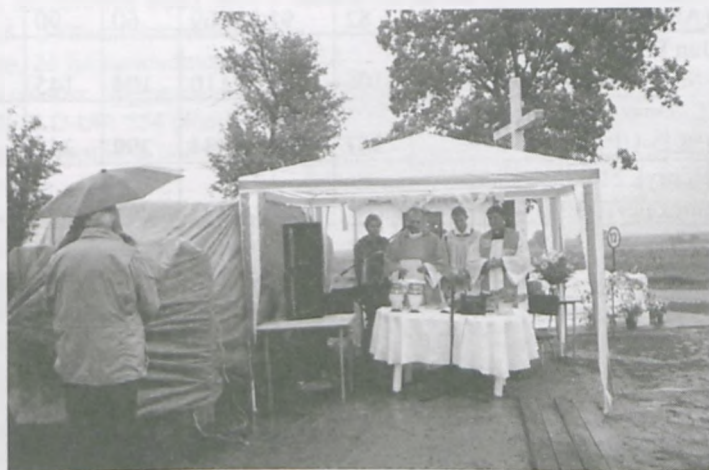
W deszczu i wietrze uroczystą Mszę św. pod nowym krzyżem odprawili księża parafialni.