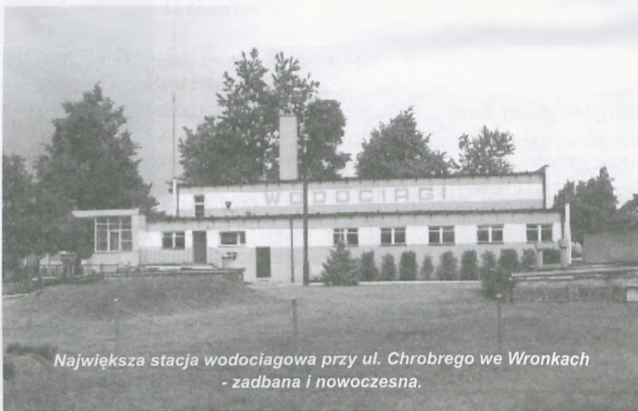
Największa stacja wodociagowa przy ul. Chrobrego we Wronkach - zadbana i nowoczesna.

Woda nie zawiera też szkodliwych bakterii coli. Osoby i instytucje zainteresowane aktualnymi wynikami badań jakości