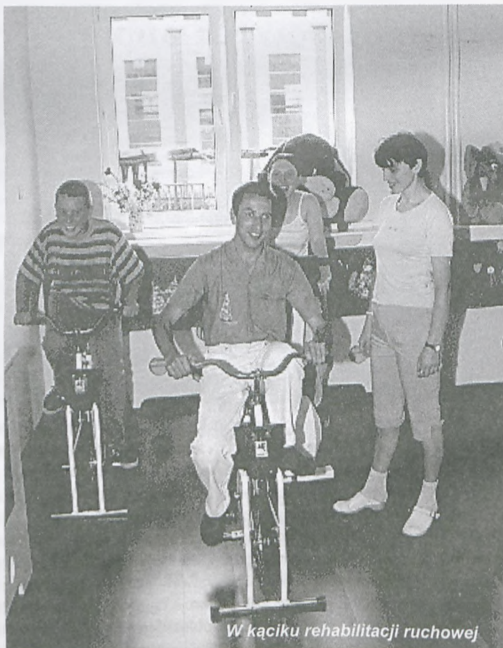
W kąciku rehabilitacji ruchowej