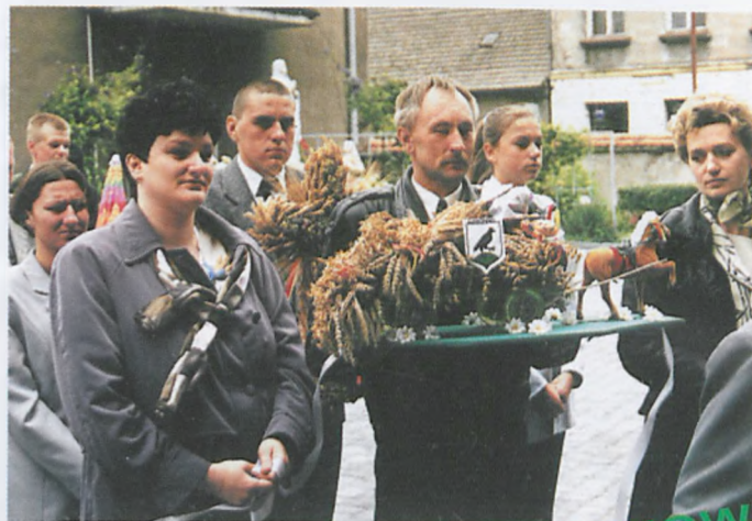
▲ Wieś Wierzchocin