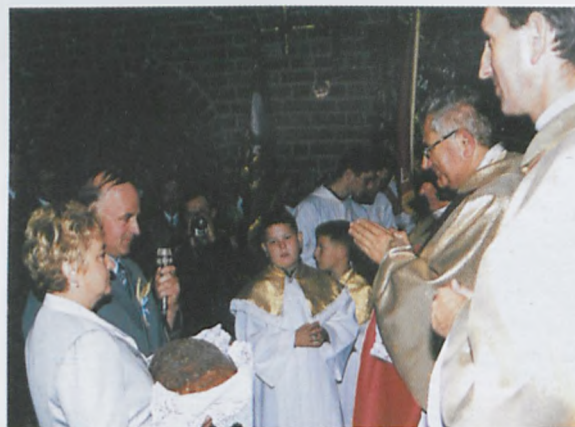
▲ Starościna i starosta dożynek wręczają bochen chleba ks. kanonikowi