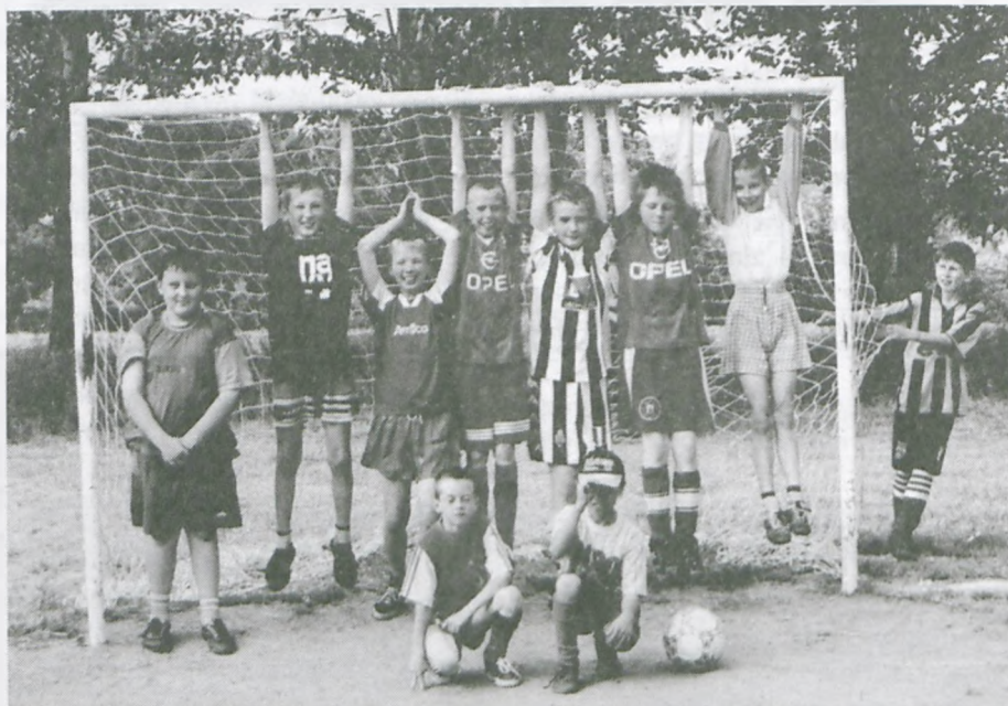
Piłkarze z „Górkii”