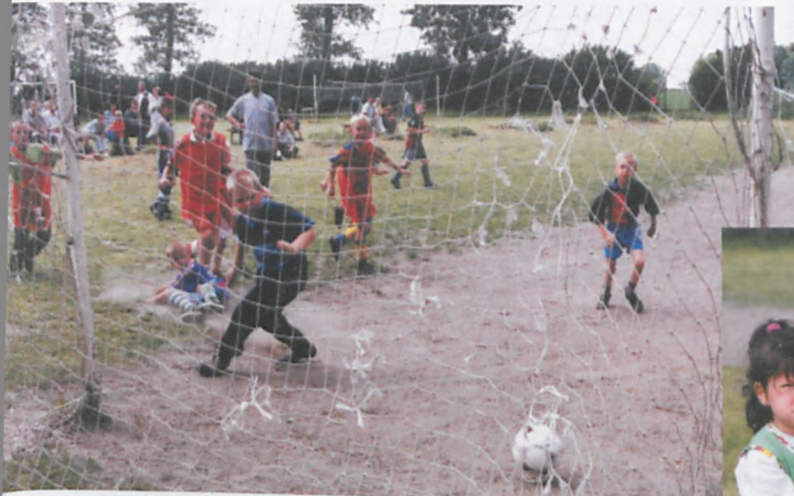
▲ Najbardziej emocjonujące pojedynki odbywały się w grupie dziesięciolatków