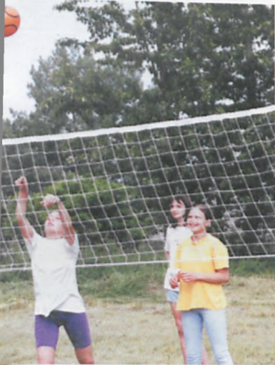
Piłka do nieba...?