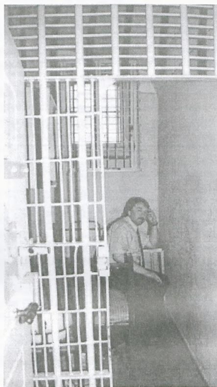
Naczelný w sanatorium