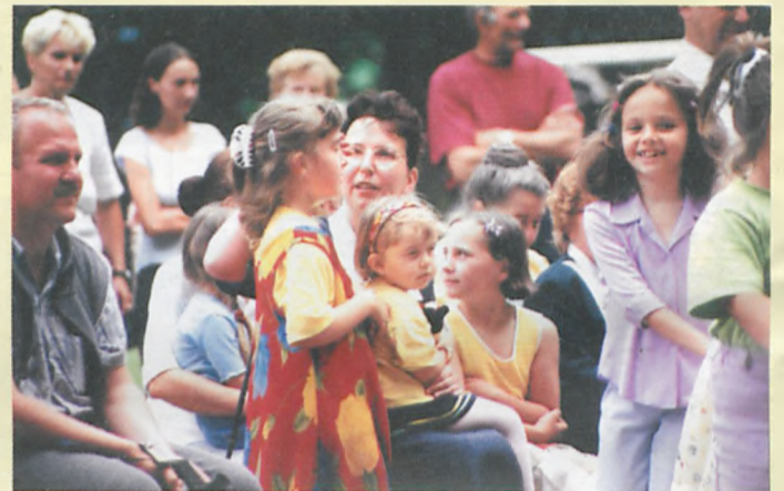
Bawili się i młodzi, i starsi...