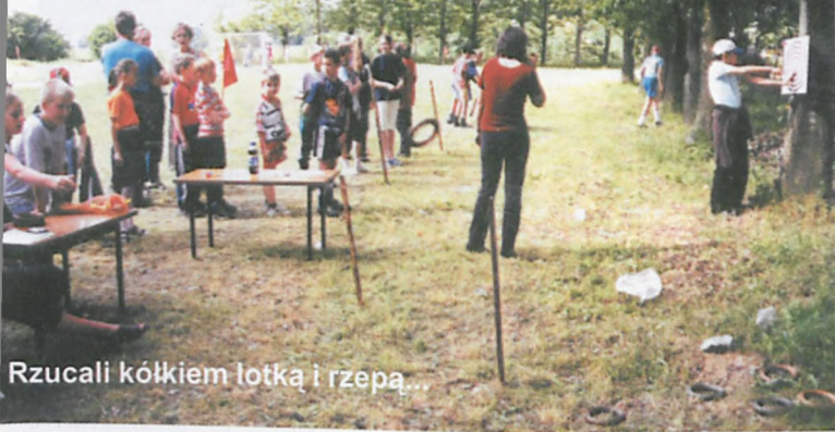
Rzucali kółkiem lotką i rzepa...