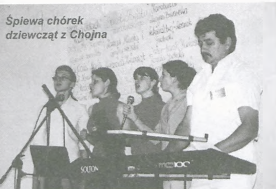
Śpiewa chórek dziewcząt z Chojna