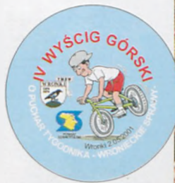
Górski Wyścig Rowerowy ▶