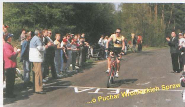
...o Puchar Wronieckich Spraw