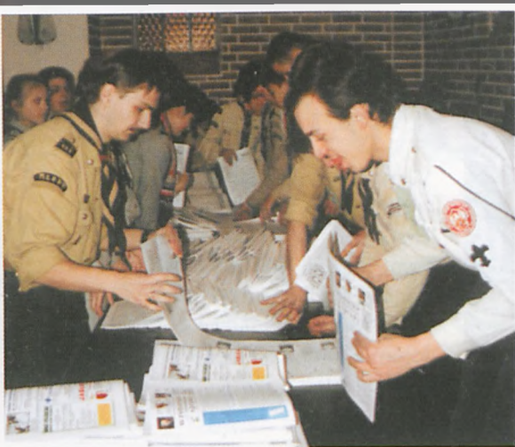
▲ Awaryjne „zbiwanie” gazety przy pomocy niezawodnych harcerzy