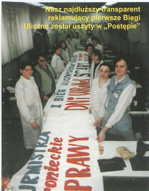
Nasz najdłuższy transparent reklamujący pierwsze Biegi Uliczne został uszyty w „Postępie”