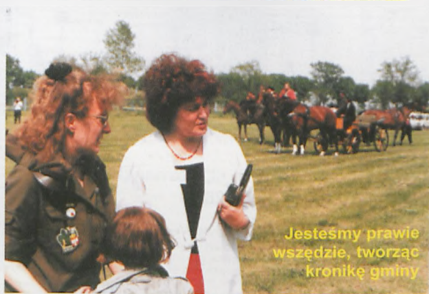
Jesteśmy prawie wszędzie, tworząc kronikę gminy