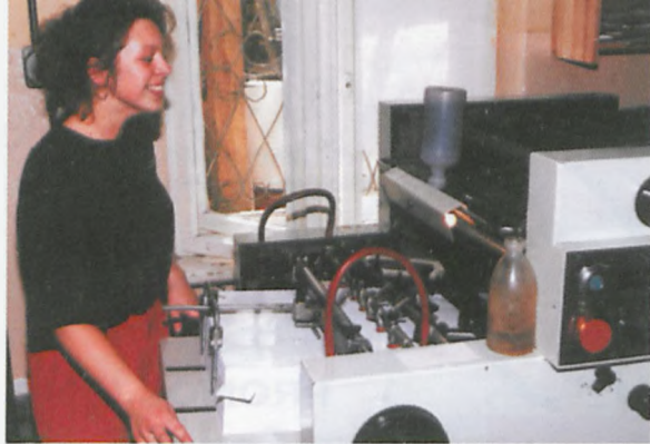
▲ Wronieckie Sprawy na przestrzeni 11 lat drukowane były w czterech drukarniach. Obecnie - w Zakładzie Graficznym STS Stanisława Sitka w Czarnkowie.