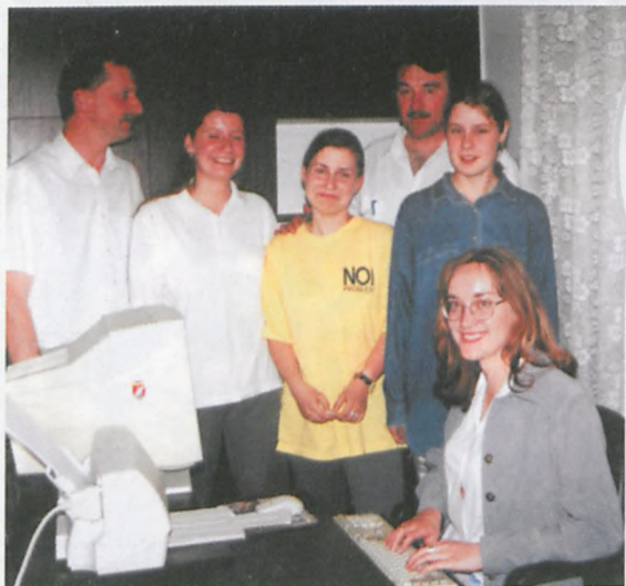
▲ Redakcja Więści z Chojna