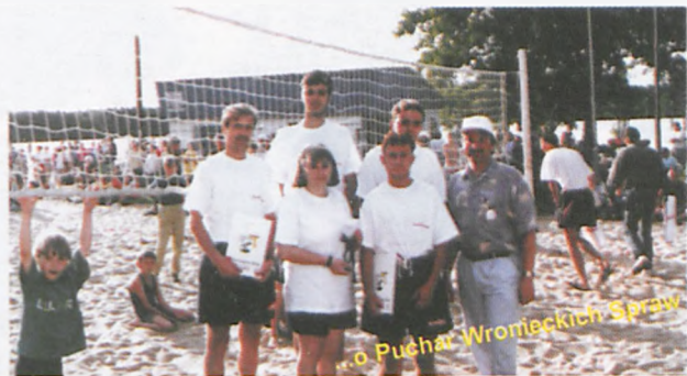
...o Puchar Wronieckich Spraw