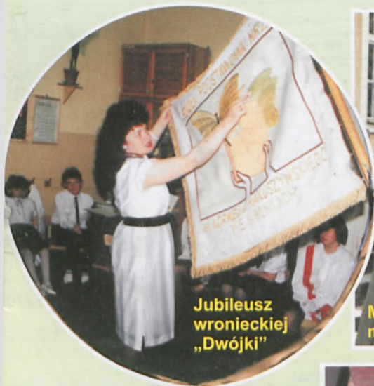
Jubileusz wronieckiej „Dwójki”