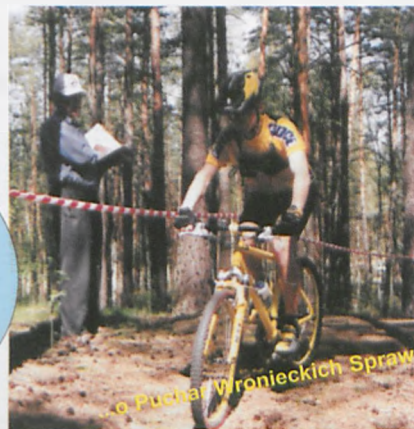
o Puchar Wronieckich Spraw