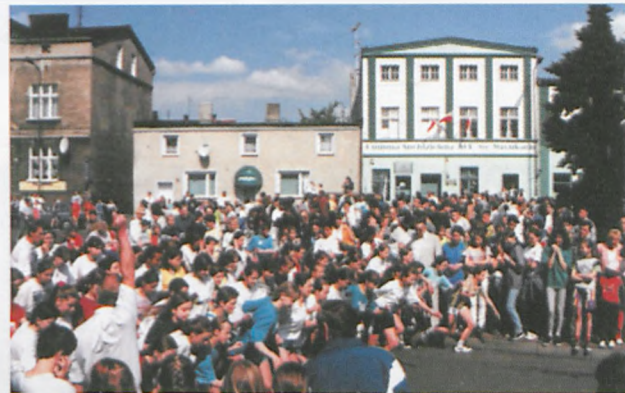
▲ Biegi Uliczne o Puchar Burmistrza Wroniek