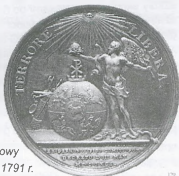
Pamiątkowy medal z 1791 r.

Witaj majowa jutrzeńko! Świeć naszej polskiej krainie, Uczymy siebie piosenką Przy hulance i przy winie.