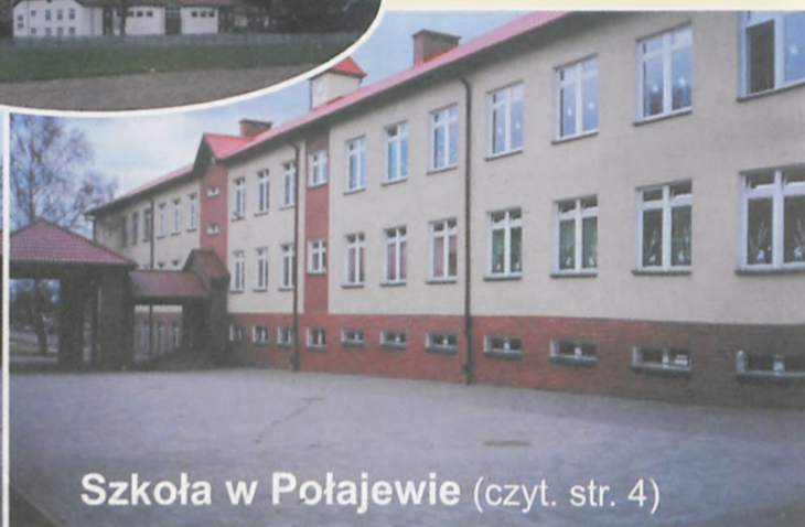
Szkoła w Połajewie (czyt. str. 4)