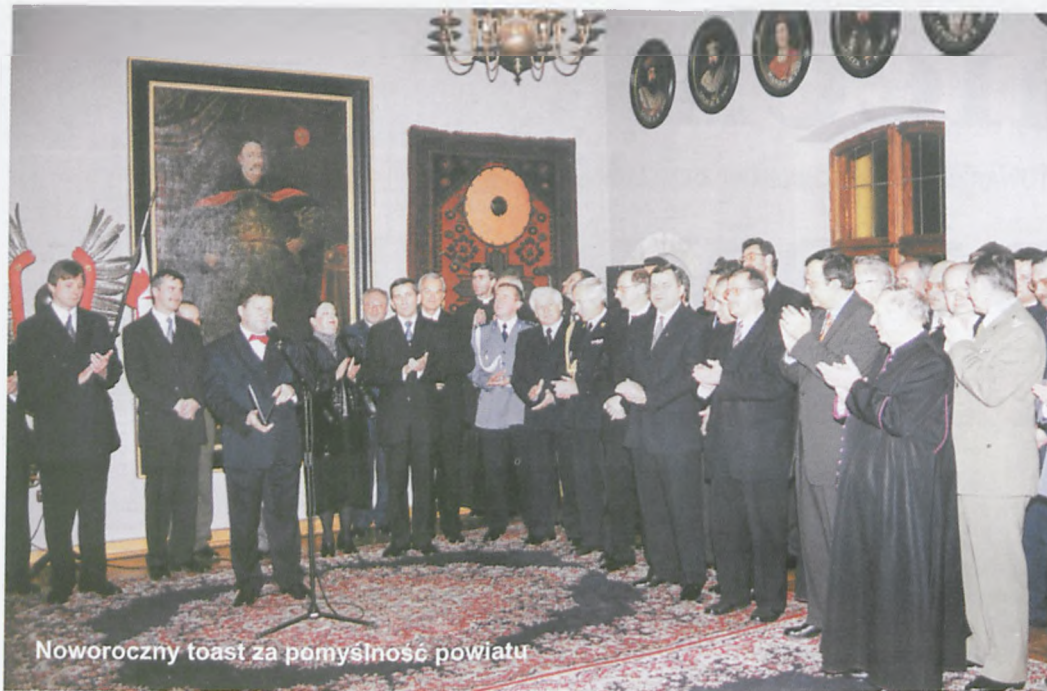
Noworoczny toast za pomyslnosc powiatu

Marszałek St. Mikołajczak pogratulował samorządowi powiatu gospodarczo, życzył dalszego rozwoju gospodarczego. Zwracał przy tym uwagę na to, aby w pędzie za nowoczesną Europą nie zatracać tożsamości regionalnej.