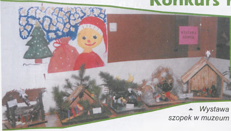
▲ Wystawa szopek w muzeum

Na konkurs ogłoszony przez wronieckie gimnazjum wpłynęły 22 szopki - prace indywidualne i zbiorowe. Tuż przed świętami jury przyznało nagrody i wyróżnienia (w dwóch kategoriach), a plon konkursu został przedstawiony na wystawie w muzeum.