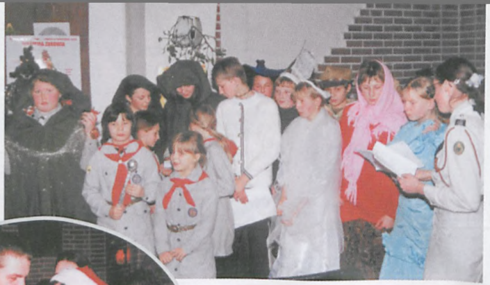
Bożonarodzeniowa szopka, kolędy oraz Gwiazdor i prezenty