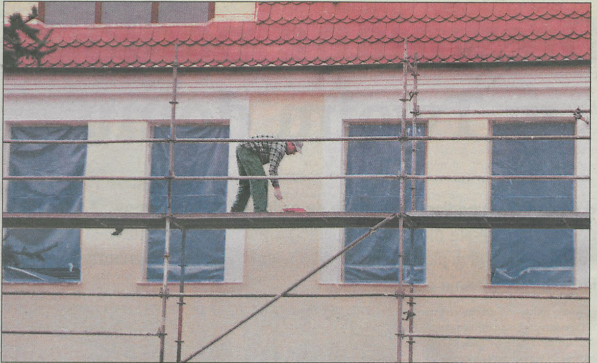
Elewacja pomalowana farbą silikonową nie przyciąga drobin kurzu

To nie bajka, jak w przypadku stoliczka, który sam się nakrywał. Ściany domu, pomalowane elewacyjnymi farbami silikonowymi, oczyszczają się same. Zdolność ta wynika z niezwykłych cech tych farb.