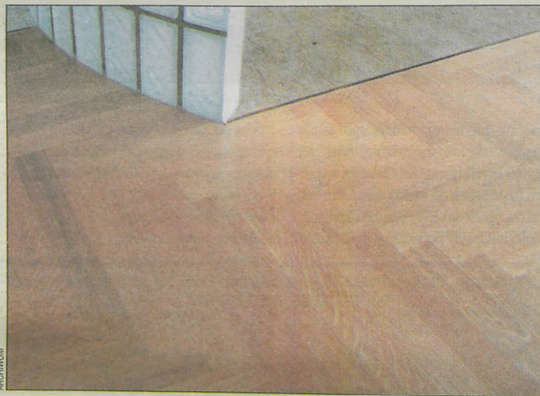
Jeśli marzymy o parkiecie, najlepiej będzie ułożyć go w cegielkę

Posadzki drewniane wykonuje się nie tylko z drewna drzew rosnących w naszej strefie klimatycznej. Coraz bardziej popularne jest drewno egzotyczne. Jest ono twarde, zatem może być układane w miejscach narażonych na większe obciążenia: w korytarzu, kuchni i pokoju dziennym. Wybór drewna egzotycznego