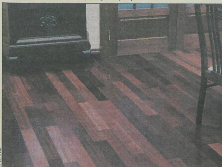
Kolor podłogi powinien być dobierany pod kątem stylistyki wnętrza

Wymiary desek i ich kolorystyka uwzględniają dziś wszelkie potrzeby klienta. Nie trzeba zatem się martwić, że wymarzony wzór i gatunek drewna nie da się dopasować do nietypowej w rozmiarach kuchni czy pokoju dzieciennego. Nie pozostaje więc nic innego, jak pozwolić sobie na odrobinę wyrafinowania, dzięki któremu nawet codzienność nabierze egzotycznego posmaku. (em)