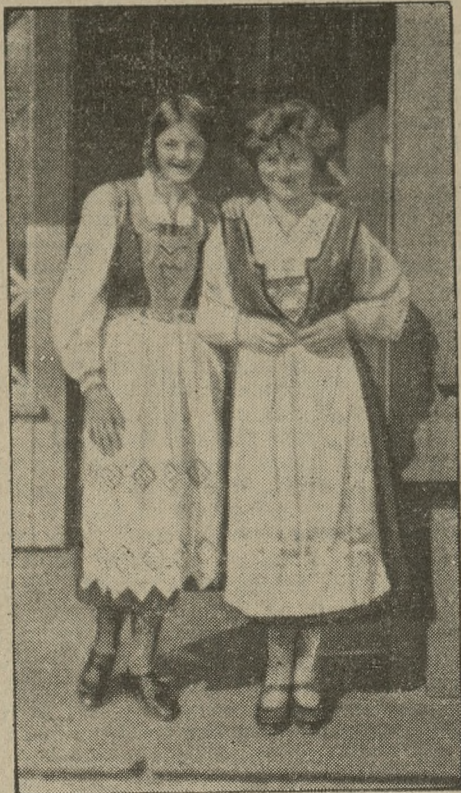
Dwie uśmiechnięte Bergenki w narodowych strojach, które z humorem pozowały do fotografii.

się dom o dwóch niskich piętrach. W ponurych izbach stoją jeszcze ławy i stoły, urządzenie prymitywne biur, trochę broni, dalej wiadra, haki i siekiery na wypadek pożaru, z którym zawsze liczyć się należało wobec drewnianej budowy całego miasta. To też jedna tylko izba, położona za domem od podwórza, posiadająca piec, i tu w zimie gromadzili się mieszkańcy. Niemiecy panowie nie przebierali w środkach, aby utrzymać w swem władaniu złotodajny handel rybami, złowionymi przez Norwegów. Historia