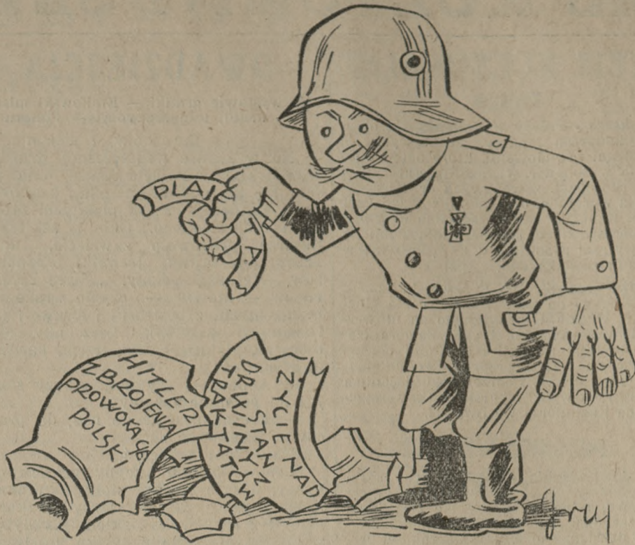
I urwało się ucho!

sząca się dużym powodzeniem, właśnie z powodu odjęcia jej zabarwienia operetkowo-rewjuowego, a więc z realizmem interpretacyjnym nie mająca nic wspólnego.