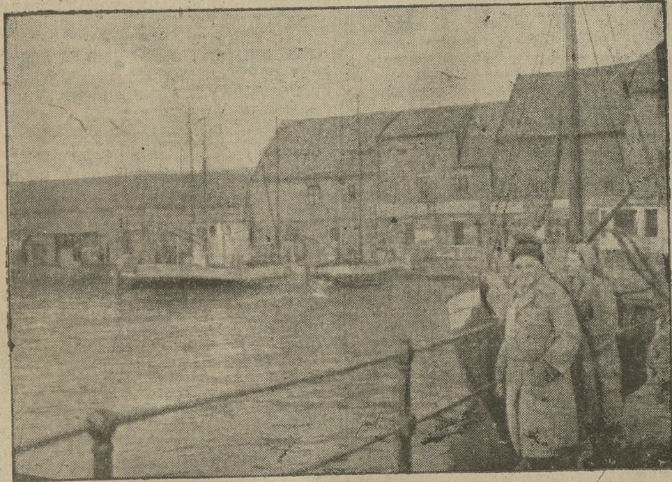
Fragment portu w Bergen, przy rynku rybnym, z charakterystycznymi drewnianymi śpichrzami w głębi. Stoi grupka pasażerów z „Polonji”

W dwa dni później na drzwiach pobliskiej masarni ukazała się karta, a na karcie: Tu do sprzedania parówki z wiewiórki, które zmarły bez żalu.