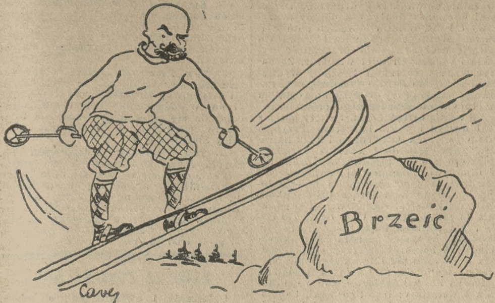
Jak premier Stawek spędził dni w Zakopanem!