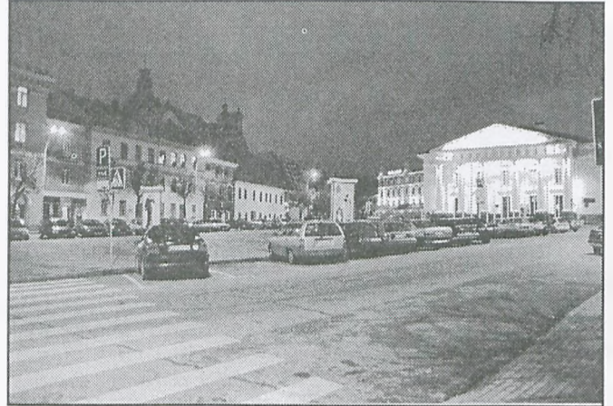
Wilno prezentuje się pięknie także nocą. Na zdjęciu w głębi Katedra Wileńska

Większość uczestników po raz pierwszy miała okazję zobaczyć obraz Matki Boskiej Ostrobramskiej