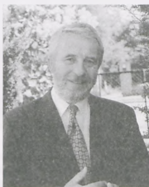
Przewodniczący Rady Miasta Lubonia

Z okazji Świąt Bożego Narodzenia składamy wszystkim Mieszkańcom Naszego Miasta życzenia, aby te świąteczne dni upłynęły w atmosferze radości i pokoju. Niech ten czas na przelomie wieków będzie zapowiedzią lepszej dla nas wszystkich przyszłości.