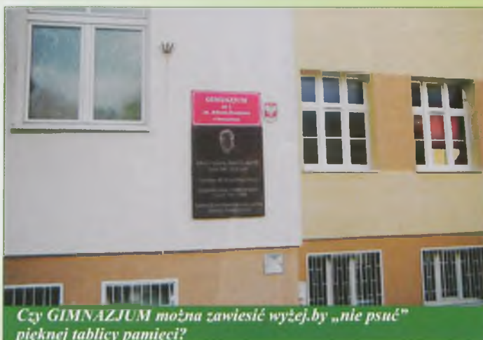
Czy GIMNAZJUM można zawiesić wyżej, by „nie psuć” pięknej tablicy pamięci?