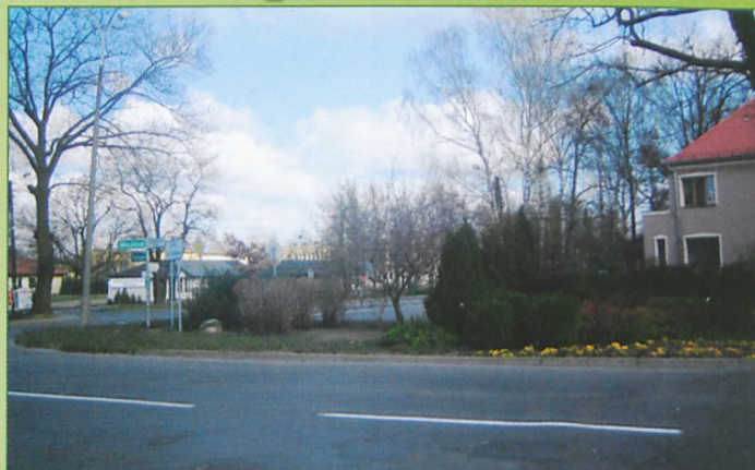
Zadbany skwer przy ul. Dworcowej, pięknie też wyglądają ronda