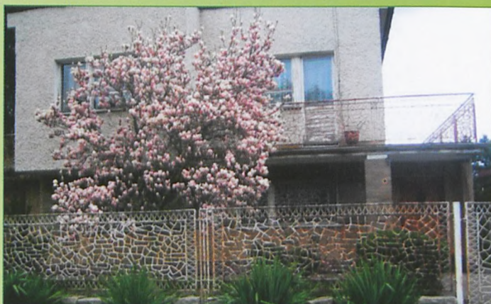
Wiosenny urok w Puszczykowie