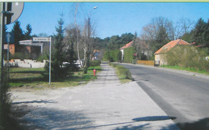
Naprawiony wjazd/przejście przy ul. Granicznej, podobnie jest przy ul. Prusa