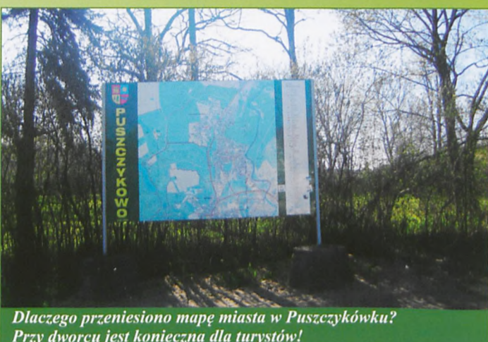
Dlaczego przeniesiono mapę miasta w Puszczykówku? Przy dworcu jest konieczna dla turystów!