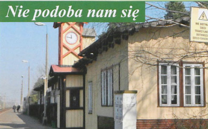
Często zepsuty (nienakręcony?) zegar, którego naprawa była niezwykle kosztowna; dlaczego odmienny kolor „wieżyczki” na zabytku?