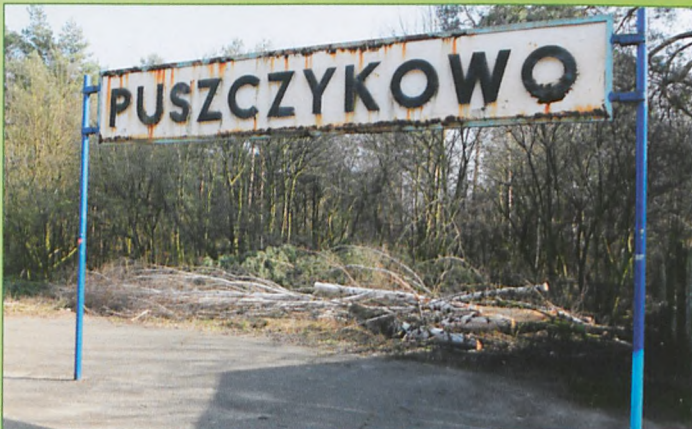
Czy na tej. stacji chce się wysiadać? Choć to własność PKP, ale też wizytówka miasta