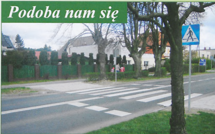
Nowe przejście dla pieszych przy ul. Magazynowej poprawia bezpieczeństwo