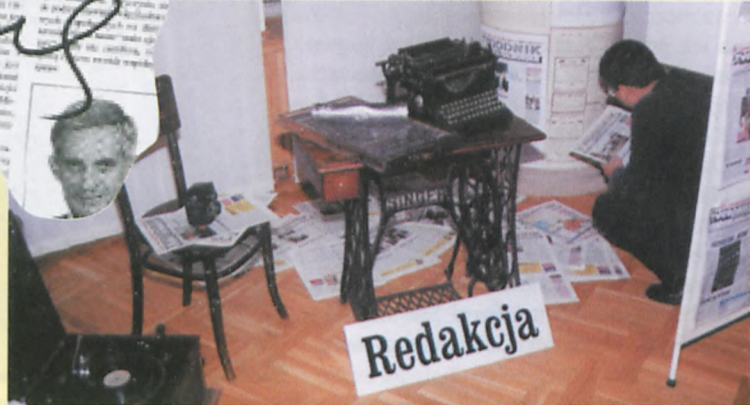
▲ Jedną z ciekawszych wystaw nagrodzonej gazety - tygodnika Nowiny Raciborskie