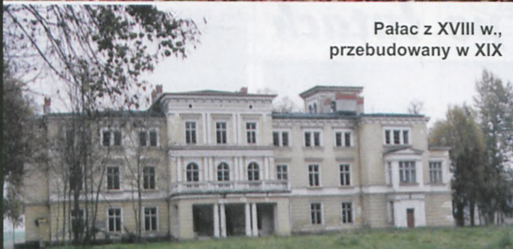
Pałac z XVIII w., przebudowany w XIX