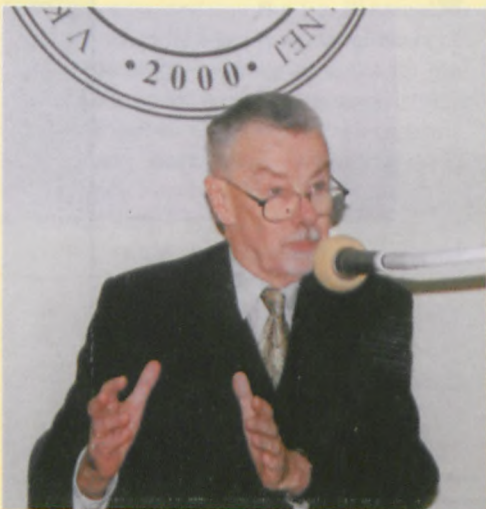
▲ Pełnomocnik Rządu ds. Negocjacji o Członkostwo Polski w Unii Europejskiej, Jan Kulakowski informował dziennikarzy o stanie i problemach negocjacji

Wspólne zdjęcie uczestników kongresu z Premierem RP, Jerzym Buzkiem ▼