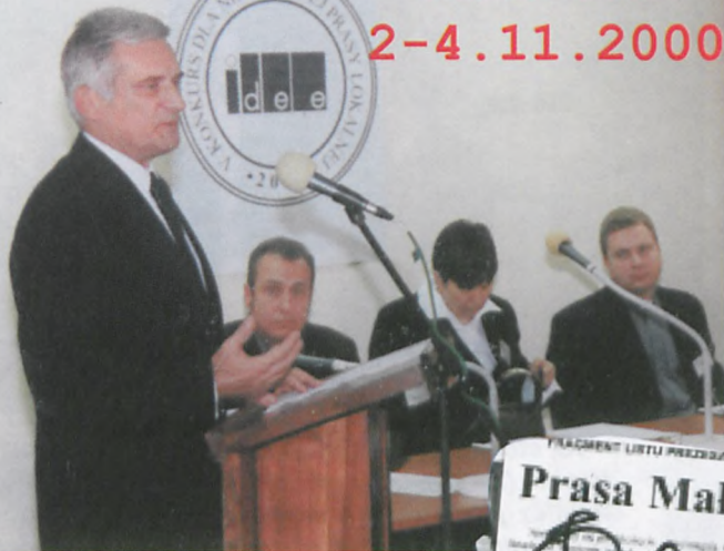
▲ Uroczystego otwarcia kongresu dokonał Premier RP, Jerzy Buzek