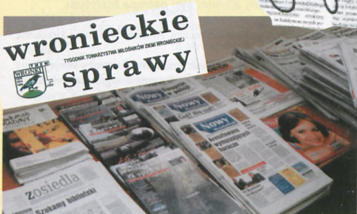
▲ Prezentacja gazet lokalnych - 57 redakcji zaproszonych na kongres

Wronieckie Sprawy na kongresie reprezentowali - prezes TMZW, Ireneusz Fowie i redaktor naczelny, Paweł Bugaj.