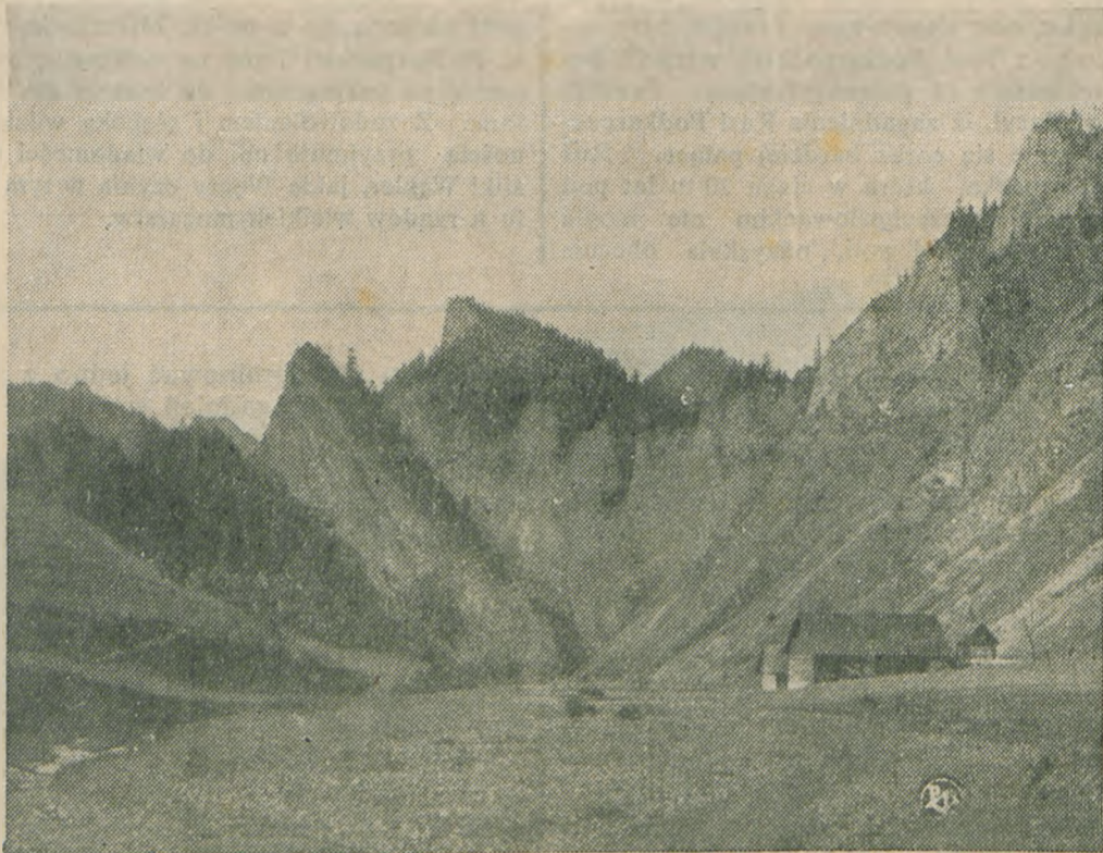
Piękna partia Piennin, odzyskanych przez Polskę od Czechosłowacji

szkolnym. Ma ono za zadanie praktycznie przygotować junaczki na kursach przysposobienia gospodyń wiejskich do pracy w małych gospodarstwach rolnych. Okres służby pracy w osiedlu w Bohorodczanach trwa trzy miesiące.