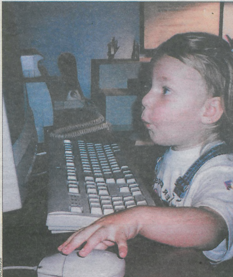
Fascynacja komputerem zaczyna się od najmłodszych lat...

Niegdyś za członków rodziny uważano nawet psy i inne zwierzęta domowe, teraz zamiast nich kupuje się komputer, który zadowoli wszystkich domowników, po-