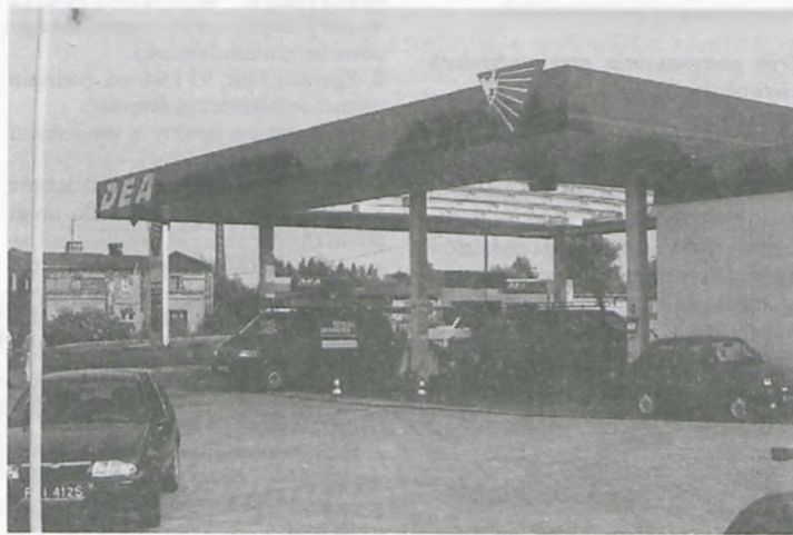
Można już tankować na nowej stacji paliw w Luboniu.

DEA - firma z udziałem kapitału zagranicznego wybudowała nowoczesną stację paliw przy wjeździe do miasta, na ulicy Żabikowskiej. Stacja jest czynna całą dobę, oprócz tankowania można skorzystać z firmowego sklepu, lub z innych usług, jak np. z myjni, czy z odkurzacza.