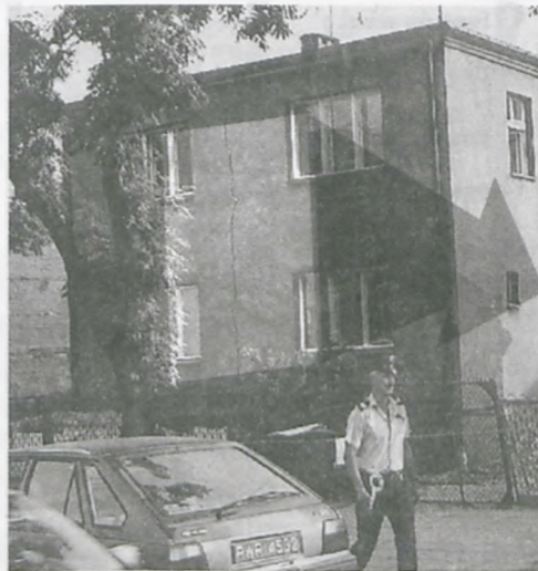
Wyjątkowo niefortunnie zakończyły się prace remontowe prowadzone na posesji przy ulicy Kościuszki 58.

5 08 99 akcja Straży Miejskiej, Policji i Straży Pożarnej w Luboniu. Przy ul. Kościuszki 58 podczas prac remontowych pęknął dom na skutek podkopanych fundamentów. W późnych godzinach popołudniowych rozpoczęła się akcja zabezpieczenia budynku przed dalszym rozpadem. Firma budowlana zakładała stemple podpierające budynek, a służby porządkowe