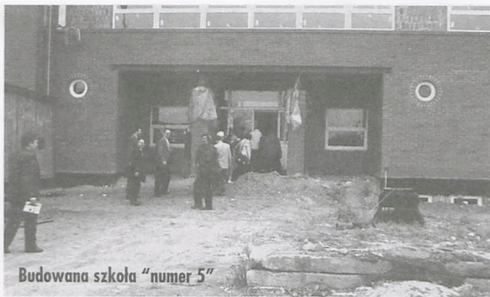
Budowana szkoła "numer 5"

Szkoła Podstawowa nr 4 - przy ul. 1 Maja, radni przedstawiali problemy związane z funkcjonowaniem szkoły.