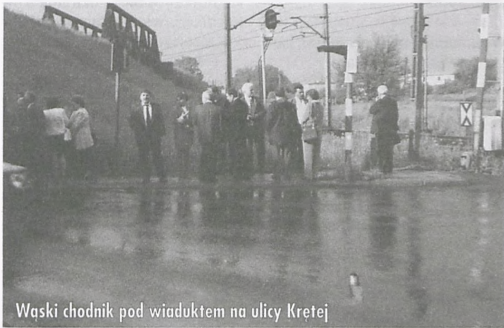
Wąski chodnik pod wiaduktem na ulicy Krętej

W głosowaniu przyjęcie uchwały poparło - 24 radnych, przeciw