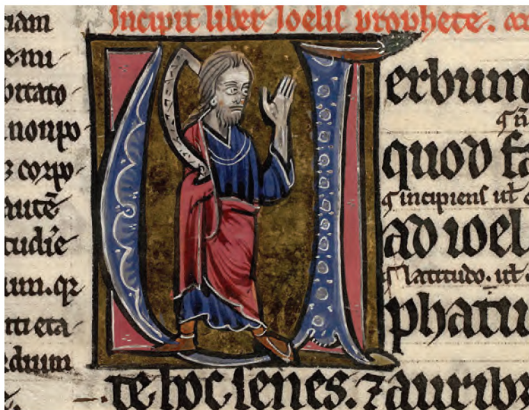
Il. 2. „Bible Glosée”. Zbiory Bibliothéque Mazarine w Paryżu (rkps 137, k. 33v)