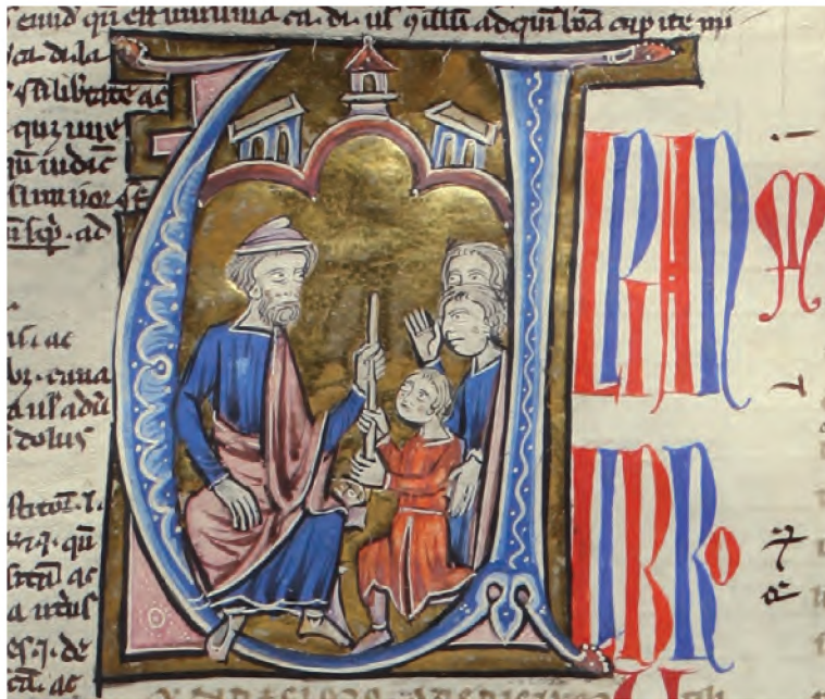
Il. 1. „Digestum vetus”. Zbiory Biblioteki Kórnickiej (BK 824, k. 42)