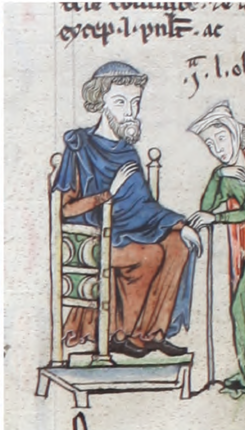
Il. 3. Psalterz („Lewis Psalter”). Zbiory Free Library w Filadelfii (rkps E 185, k. 8v)