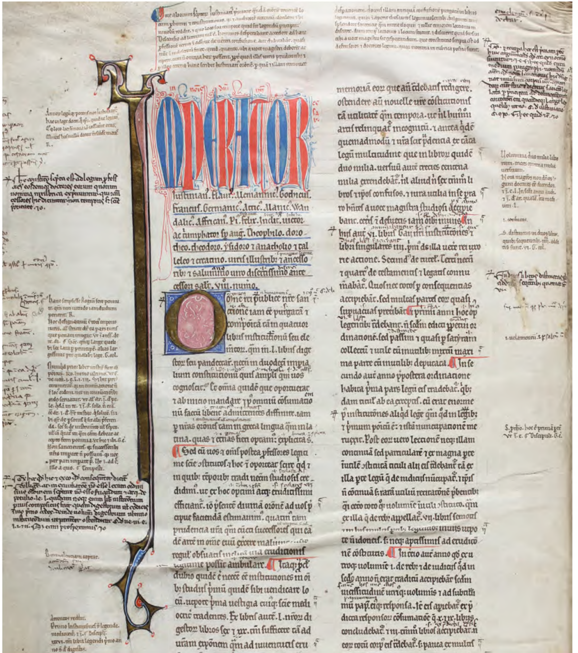
Il. 5. „Digestum vetus”. Zbiory Biblioteki Kórnickiej (BK 824, k. 1)