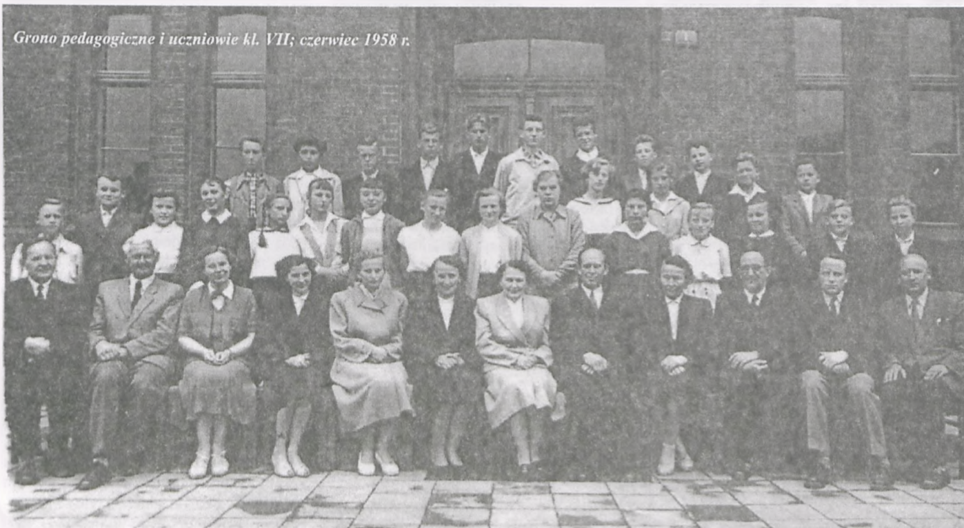
Grono pedagogiczne i uczniowie kl. VII; czerwiec 1958 r.