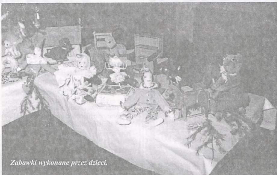
Zabawki wykonane przez dzieci.

Półkolonia cieszyła się dużym powodzeniem, corocznie uczestniczyło w niej 80 – 110 uczniów. Dla pracujących matek to zapewnienie dziecku opieki od godz. 9.00 do 17.00, z trzema posiłkami dziennie, było bardzo ważne.