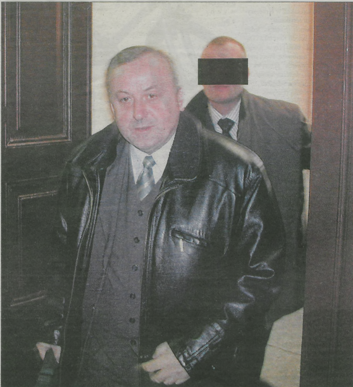
Posiedzenie trwało około dziesięciu minut