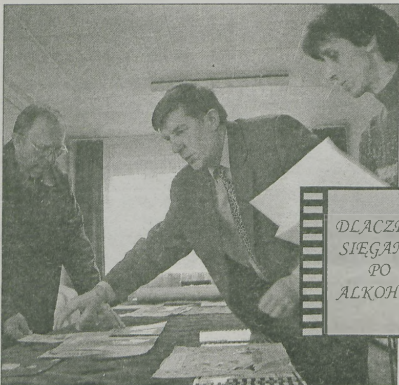
Jury podczas obrad

W piątek w rozdrażewskim Urzędzie Gminy rozstrzygnięty został V konkurs plastyczny o tematyce antyalkoholowej, przemocy w rodzinie i zapobiegania narkomanii.