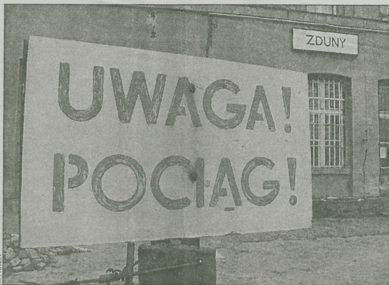
Czy dworzec będzie należał do gminy?

Czy zdunowscy radni upoważnią burmistrza Władysława Ulatowskiego do rozmów z PKP na temat przejęcia przez samorząd dworca kolejowego wraz z przylegającym do niego terenem?