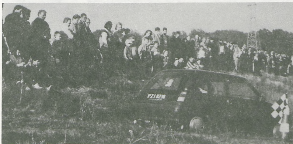
Wyścigi samochodowe zawsze pasjonowały mężczyzn - na zdjęciu trasę przejazdu pokonuje Roman Sakwa.