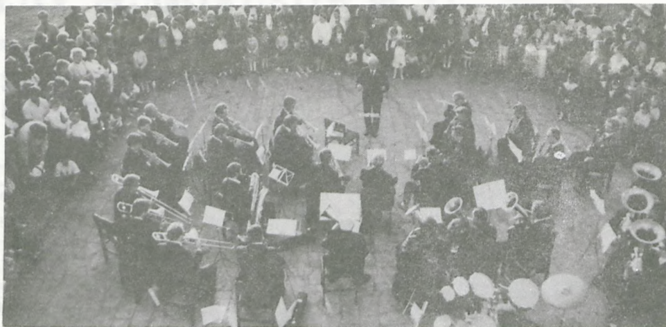
Koncertu orkiestry ZNTK wysłuchała (stojąc) spora liczba mieszkańców Lasku.