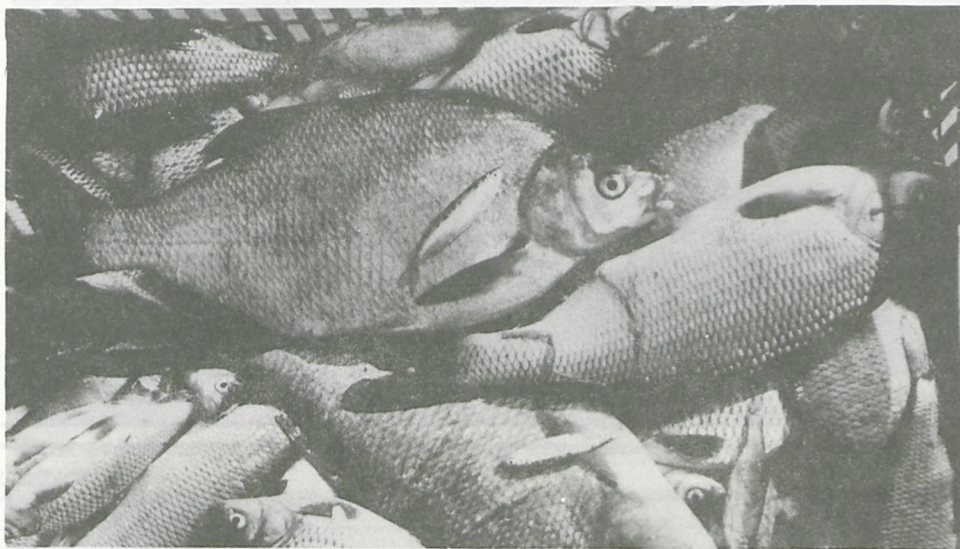
Plon wędkarzy - nawet w Warcie złowić można taaaakie ryby.