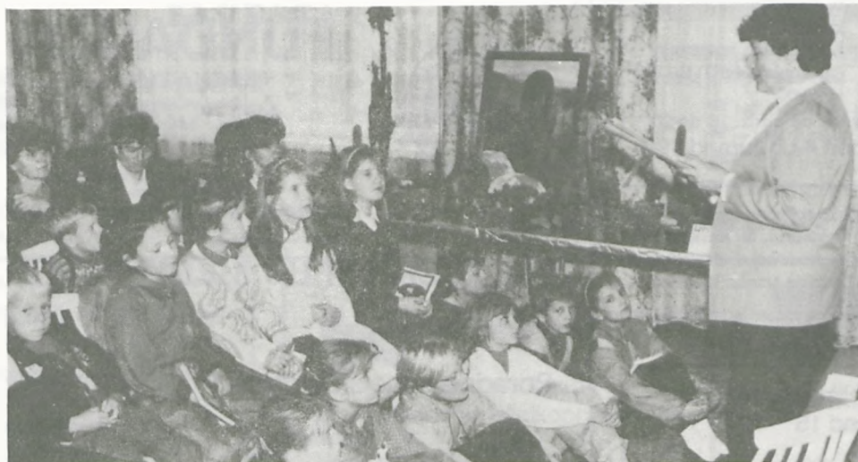
Wystawa kaktusów to atrakcja ale spotkanie z "żywą" Małgorzatą Musierowicz to dopiero przeżycie.