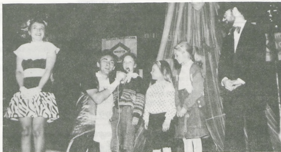
Szansę wystąpienia na scenie obok "prawdziwych" aktorów miały dzieci w Lubońskim Ośrodku Kultury.