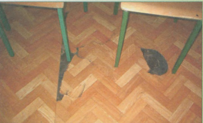
W tak zniszczonej i brudnej sali spotykają się organizacje pozarządowe - od czasu użytkowania sali przez uczniów dewastacja sali postępuje; liczyliśmy na wakacyjny remont...