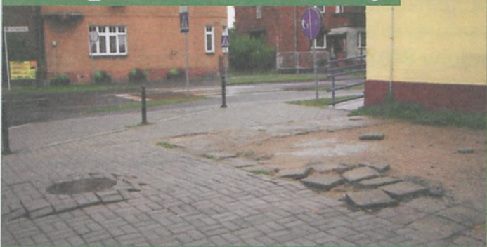
Parking przed PKO przy ul. Podgórznej to wielki wstyd