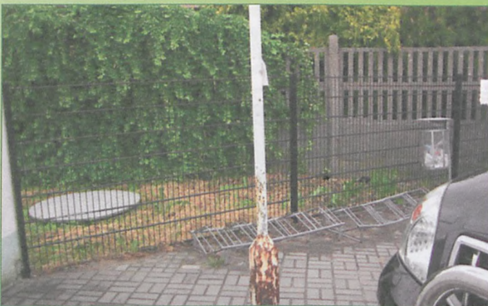
ul. Magazynowa - zardzewiała lampa przed pocztą chluby nie przynosi