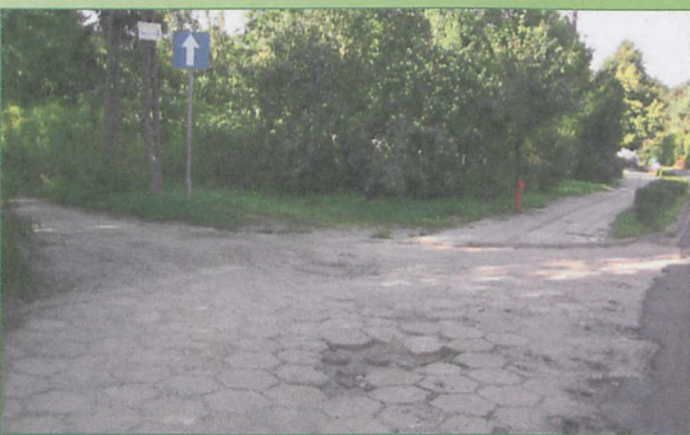
Niebezpieczna dziura studzienkowa ul. Dworcowa/Graniczna