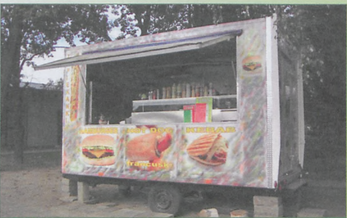
ul. Dworcowa - szpetna budka na ceglach zepsuła otoczenie odnowionego dworca