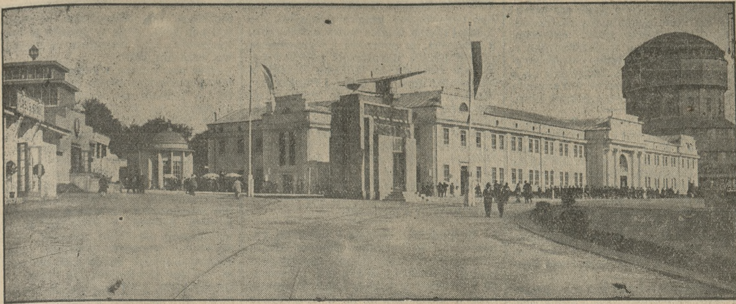
Tereny Targów Poznańskich.