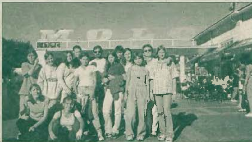
Uczestnicy obozu przed molo w Sopocie