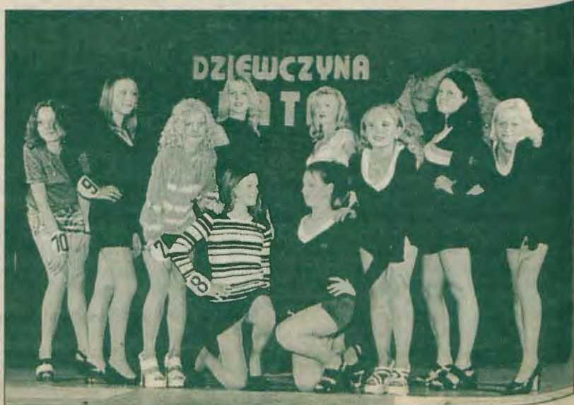
Pierwsza prezentacja przed publicznością