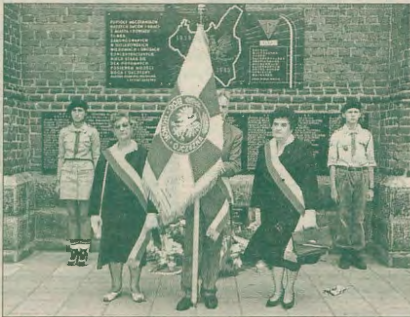
Poczet sztandarowy SPK przed kościołem NSPJ w Turku

wiecki i poczty sztandarowe Światowego Związku Żołnierzy AK w Turku, „Sybiraków” i Związku Harcerstwa Polskiego. Na uroczystości pojawili się również przedstawiciele SPK z Londynu.