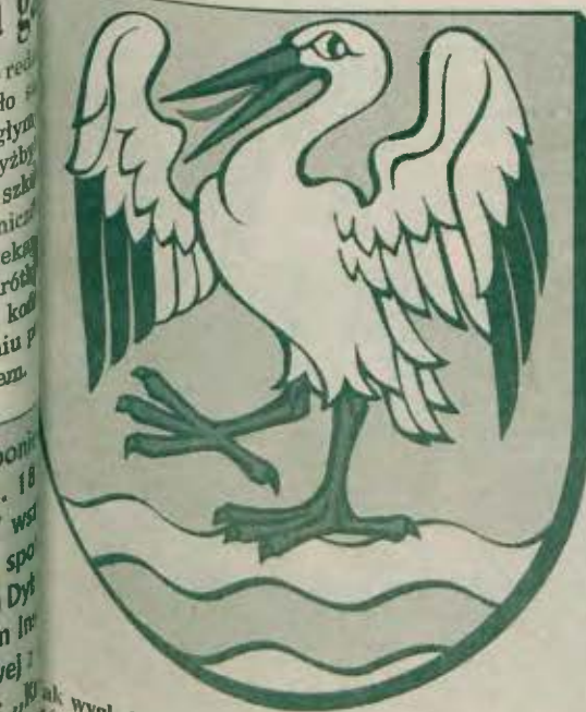
„Kawęczyn” jak wygląda projekt przyszłego herbu, który zostanie jeszcze nieco zmieniony