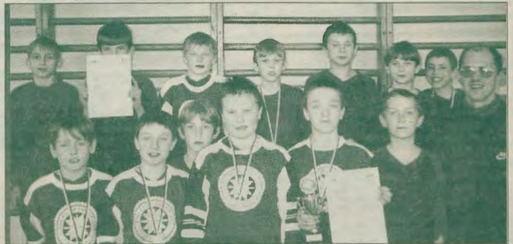
Mistrzowski zespół ze SP 4