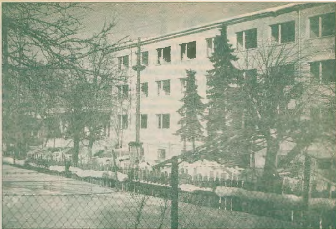
1959 r. Gmach Szkoły Podstawowej nr 2 w budowie.