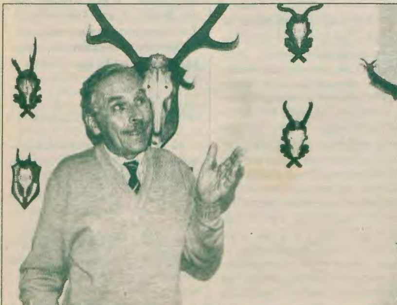
Ważne miejsce w domu zajmują trofea myśliwskie ojca i dziadka