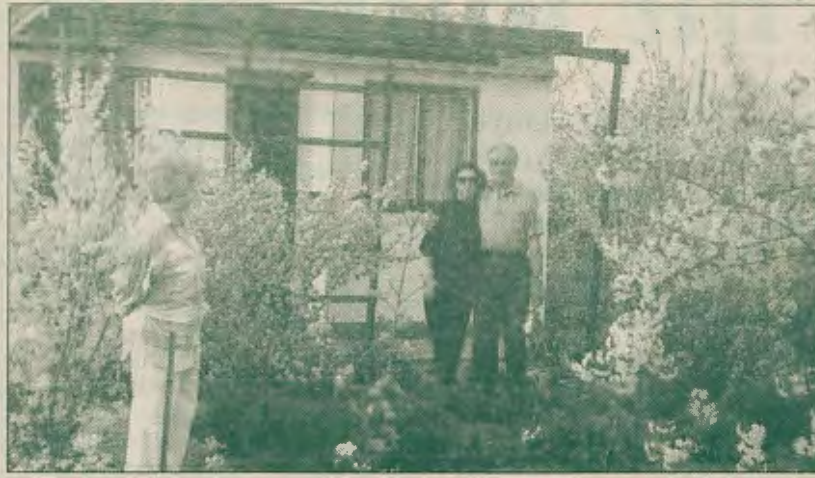
Na działce z synową i żoną

Pan Ratyński jest osobą bardzo popularną na swoim osiedlu - wszystkie klucze do mieszkań wręczał