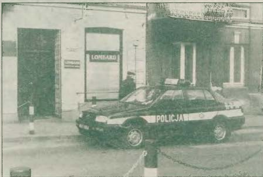
Policyjne radiowozy stanęły pod lombardem, a tymczasem przestępcy byli już daleko

Ps. Trzy lata temu mieszący się w tym samym lokalu kantor także został obrabowany w biały dzień, w podobnych okolicznościach. Sprawców nie ujęto. Kolejny napad w centrum miasta pokazuje, że bandyci czują się tu pewnie. A jak się czują ci, którzy odpowiadają za bezpieczeństwo?