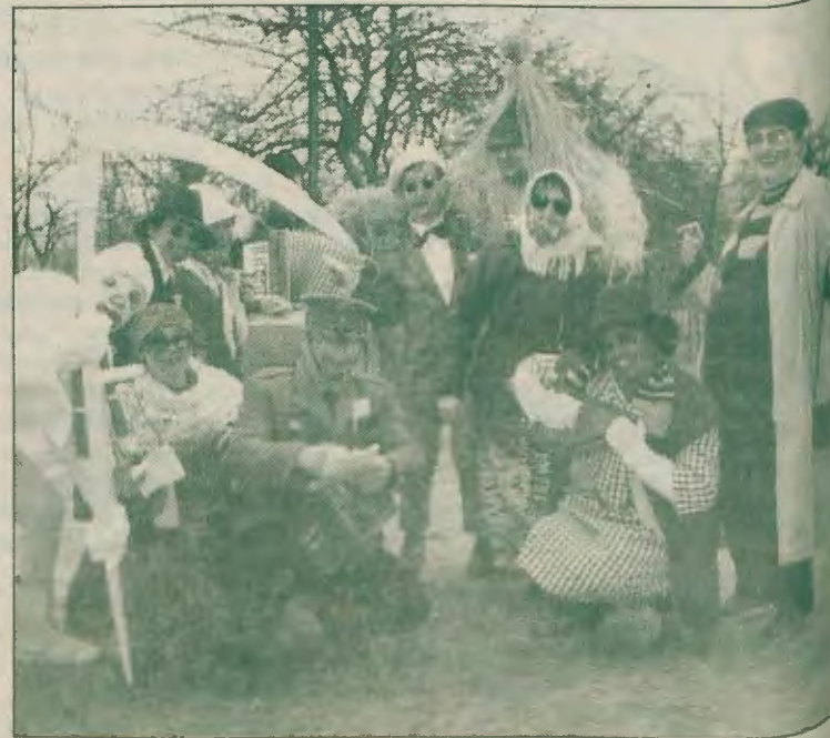
Uczestnicy „zapustów” w Galewie