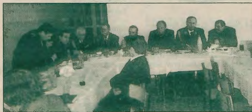
Przy wspólnym stole zasiedli samorządowcy i strażacy