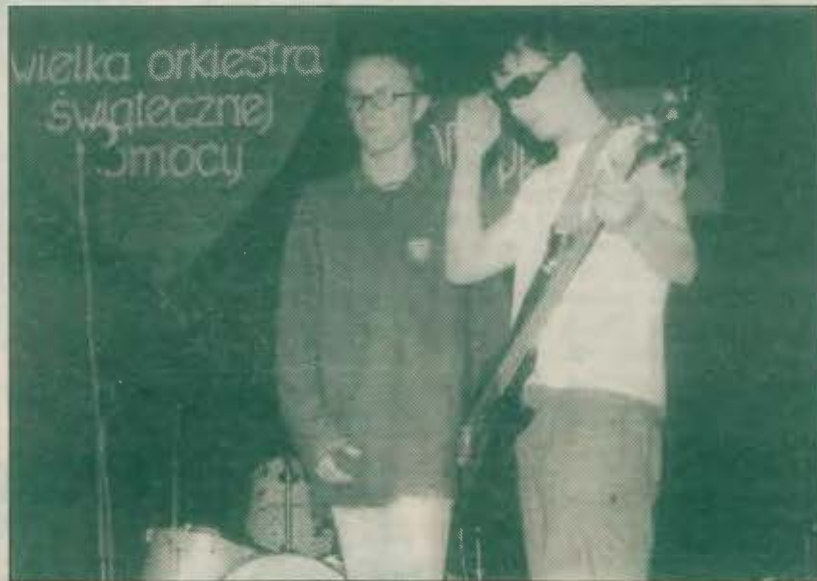
Zespół rockowy „Hemp” rozgrzewał publikę

nak niezbyt chętnie uczestniczyli w tej akcji. Najczęściej licytowali samorządowcy, a najwyższą sumę za plakat (350 zł) i koszulkę (250 zł) zaoferował anonimowy nabywca. W poniedziałek poinformowano, że w Turku na Wielką Orkiestrę Świątecznej przekazano 14.300 zł, czyli o 3.300 zł więcej niż w roku ubiegłym. Dwie puszki wolontariuszy okazały się rekordowe, w jednej było 1.030 zł, a w drugiej 989 zł.