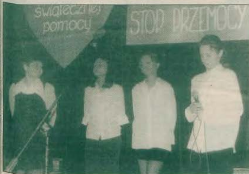
Grupa „Logorea” śpiewała kolędy