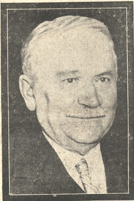
SP. PREZ. GASTON DOUMERGUE.

Unia Republikańska na której czele stoi b. minister sprawiedliwości Bernard postanowiła jednogłośnie odmówić zaufania rządowi i głosować przeciw projektowi. Lewica demokratyczna natomiast odroczyła swą uchwałę, oczekując na oświadczenia jakie mają dziś złożyć przed komisją finansową Senatu premier Blum i Auriol.