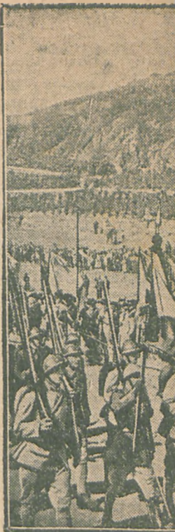
POMNIK KU CZCI TURENI

W miejscowości Turonostonięto niedawno pomarszałka Turenne. Z przemarsz wojsk francuzym pomnikiem. Marszjednym z najwybitniejszych dwika XIV i wslawil si bitwie pod Tuerkheim.