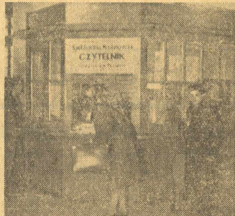
Kiosk „Czytelnika” na dworcu

Jeżeli chodzi o nakłady książek, to dotychczas wydano około 200 dzieł, a wydania ich wahają się w ramach od 3—250 tys. Przebieg nakład rzeczy nowych wynosi po 10 tysięcy egzemplarzy. Niedawno wydano szereg dzieł Arkadego Fiedlera, wielkopolskiego pisarza. „Czytelnik” wypuścił również sto kilkudziesięciu biblioteczek, zawierających po 50 tomów. Ponadto posiada 100 kompletów czytelników stałych i ruchomych, zawierających około 20 tys. tomów, łącznej wartości