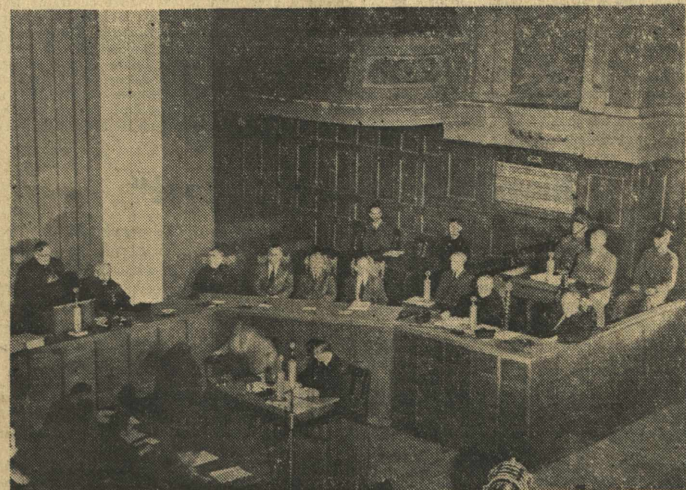
FRAGMENT SALI SĄDOWEJ

ry w tej strasnej wojnie i przeszedł przez okres strasznego sponiewierania i wycucia z wszelkich ludzkich praw. Dziś, kiedy w jego rękach znajdują się ludzie, którzy niedawno byli w roli władców tego kraju, panów życia i śmierci każdego obywatela polskiego, nie szuka on zemsty, nie pragnie walczyć tymi potwornymi środkami, jakimi walczyli i zwyciężali satrapowie. Jako pierwszym ogniwem wymiaru sprawiedliwości Najwyższy Trybunał Narodowy będzie kierował się zasada-