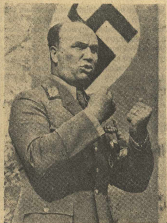
W TEJ SAMEJ AULI U. P.

siatki aparatów fotograficznych utrwała moment, kiedy bezwzględny satrapa nie tak dawno jeszcze pan życia i śmierci milionów