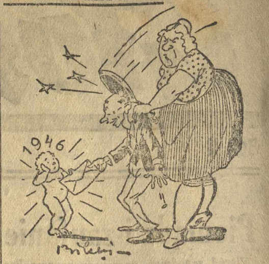
Rys. Błoki Podarek noworoczny

Z Nowym Rokiem wesoło w życie nowe prawo małżeńskie. Jeden miły podarek dla ludziom Rok Nowy; dla kłótliwych małżonków: liścik rozwodowy.