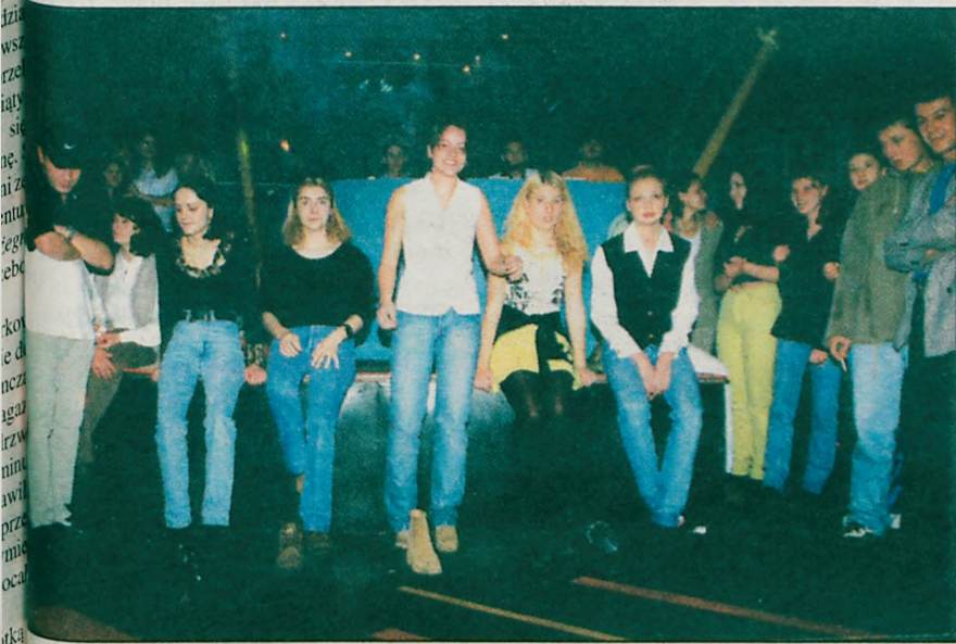
Panny z bucikami czekają na start