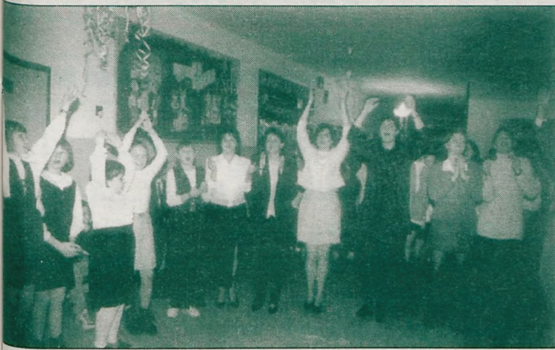
W Szkole Podstawowej w Kaczkach odbył się zjazd absolwentów okazji 25-lecia tej placówki. Podsumowaniem zjazdu była wielopokolewowa zabawa.