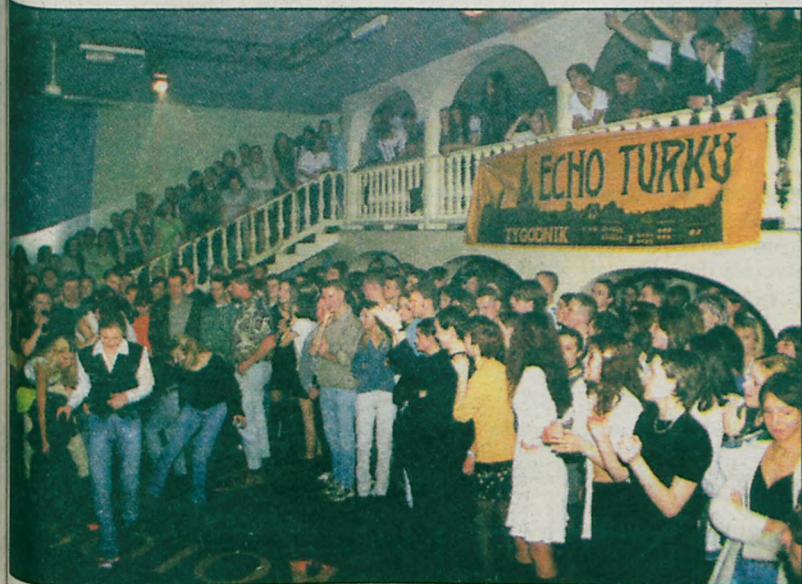
Dyskoteka była wypełniona po brzegi