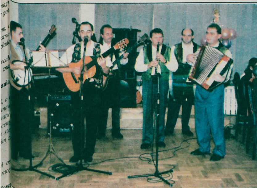
„Retro” gra i śpiewa na każdej górniczej imprezie

Górnicy przy muzyce i obficie zastawionych stołach bawili się do późnych godzin nocnych. W końcu tylko raz kończy się 20 lat. AZ