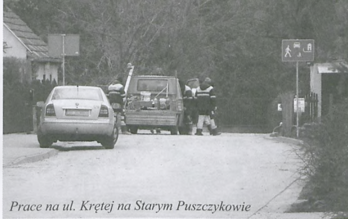
Prace na ul. Krętej na Starym Puszczykowie

Kiedy zamykaliśmy ten numer „Echa Puszczykowa” wykonawca ulicy Krętej na Starym Puszczykowie kończył już prace. Zakres robót obejmował około 120 metrowy odcinek. Nowa ulica ma teraz nawierzchnię z kostki typu pozbruk, chodnik oraz kanalizację deszczową. Prace na ul. Krętej stanowiły I etap tej inwestycji (prace na pozostałych odcinkach będą kontynuowane w późniejszym terminie) i były realizowane zgodnie z zapisami tzw. Rankingu ulic.