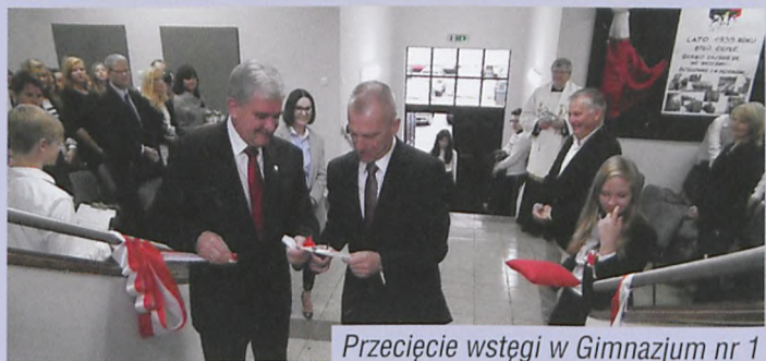
Przecięcie wstęgi w Gimnazjum nr 1