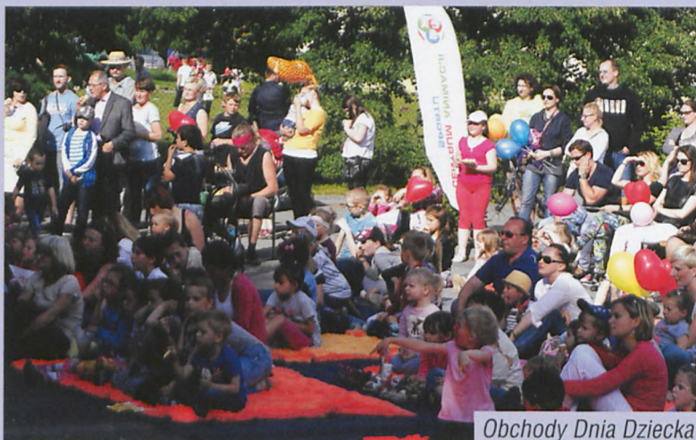
Obchody Dnia Dziecka

organizacja i promocja akcji i imprez miejskich: Dni Puszczykowa, Dzień Dziecka, Mikołajki, Projekt Uganda, Zostaw Podatek w Puszczykowie, akcja Wyrzucamy graty z chaty, kalendarz selekcjonera