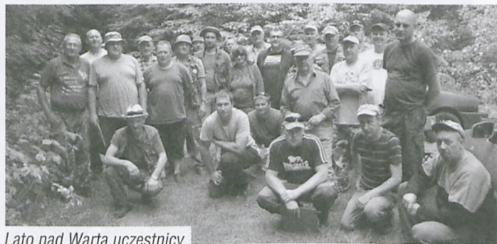
Lato nad Wartą uczestnicy

6 lipca spotkaliśmy się w Puszczykowie Koło domu Rusalka, aby rywalizować w kolejnych zawodach o tytuł „Wędkarza Roku 2014” w kategorii spławikowej. Doskonałe warunki pogodowe – bezchmurne niebo, bez wiatru dało nadzieję na miłe spędzenie niedzielnego poranka. O godz. 7 trąbka