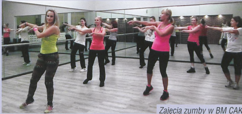
Zajęcia zumbi w BM CAK