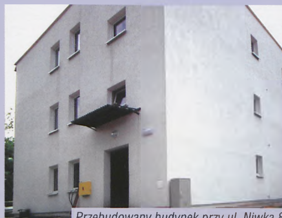
Przebudowany budynek przy ul. Niwka 8