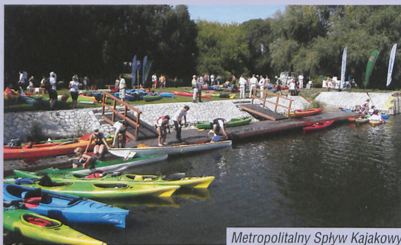
Metropolitalny Spływ Kajakowy