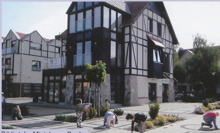
Biblioteka Miejska na Rynku

współfinansowanie corocznych koncertów organowych