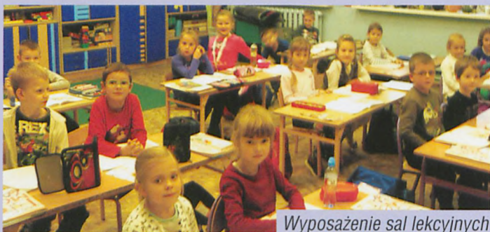
Wyposażenie sal lekcyjnych