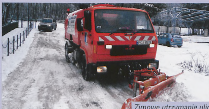
Zimowe utrzymanie ulic