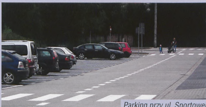
Parking przy ul. Sportowej