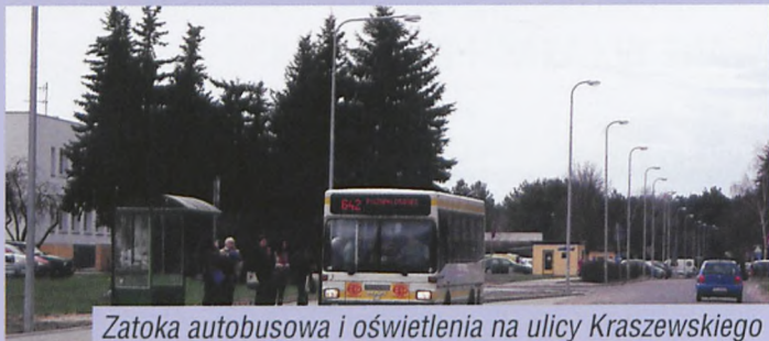
Zatoka autobusowa i oświetlenia na ulicy Kraszewskiego