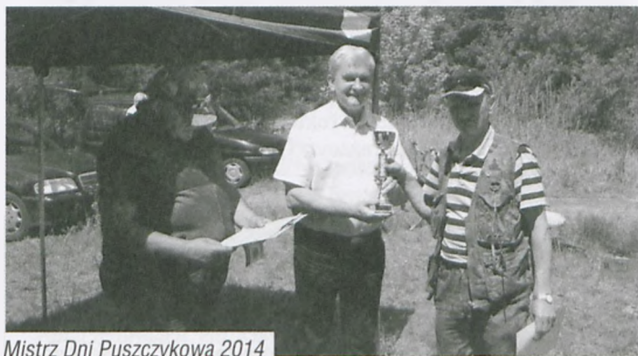
Mistrz Dni Puszczykowa 2014

Drugą imprezą spinningową w tym samym miesiącu (24 sierpnia) , były zawody „ Spinning Rogalinek 2014 ”. Wędko-