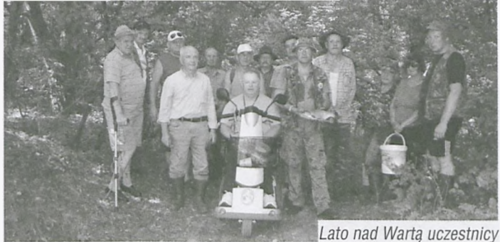
Lato nad Wartą uczestnicy

Piątego października br. spotkaliśmy się na ostatnich już w tym roku zmaganiach w dyscyplinie spławikowej. „ Zakończenie sezonu spławikowego 2014 ” kończy oficjalnie „bój” spławikowy. Był to element motywujący dla tych wędkarzy, którzy chcieli dołączyć do grona najlepszych w tym roku zawodników i dla obecnej czołówki, która musiała udowodnić, że zasłużyła na swoje miejsca w klasyfikacji ogólnej. Rozpo-