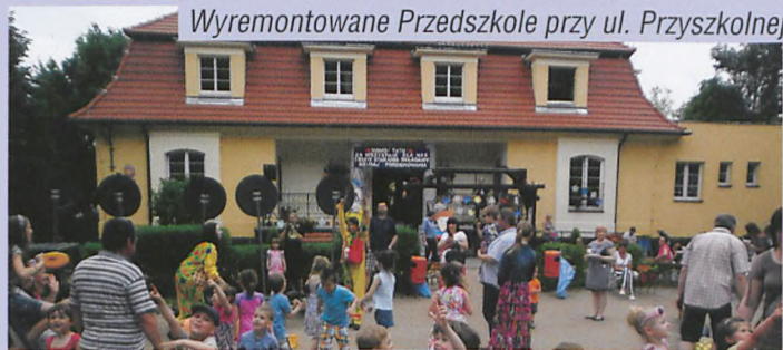
Wyremontowane Przedszkole przy ul. Przystkolnej