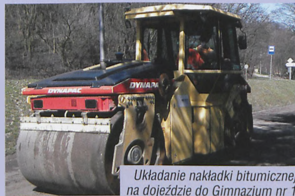
Układanie nakładki bitumicznej na dojeździe do Gimnazjum nr 1