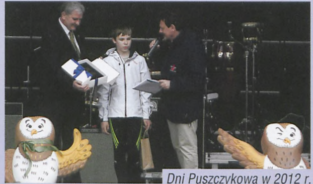
Dni Puszczykowa w 2012 r.

zakup budynku na Rynku i adaptacja budynku na Rynku na Bibliotekę Miejską