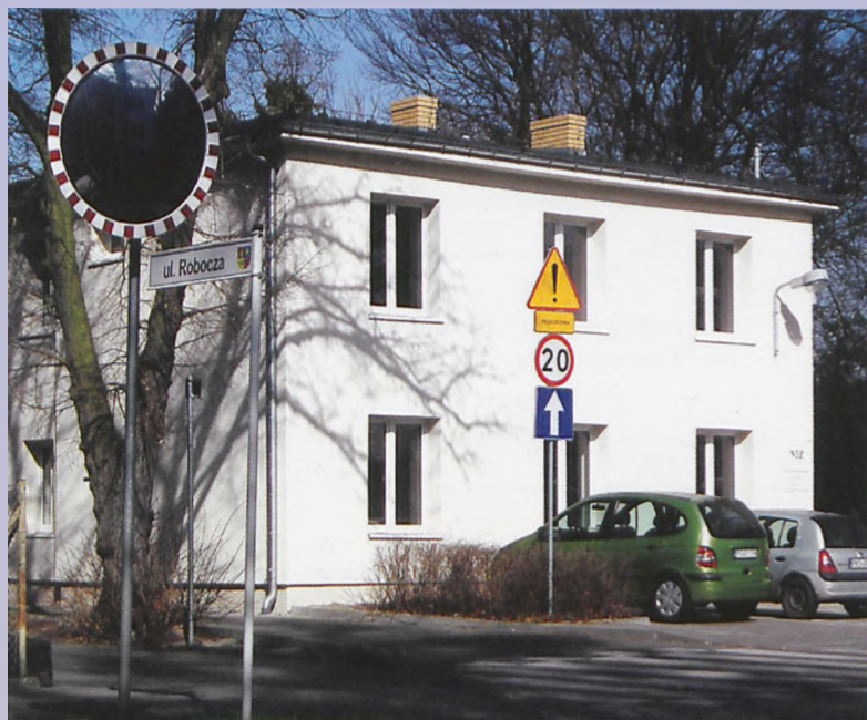
Wyremontowany budynek przychodni przy ul. Poznańskiej