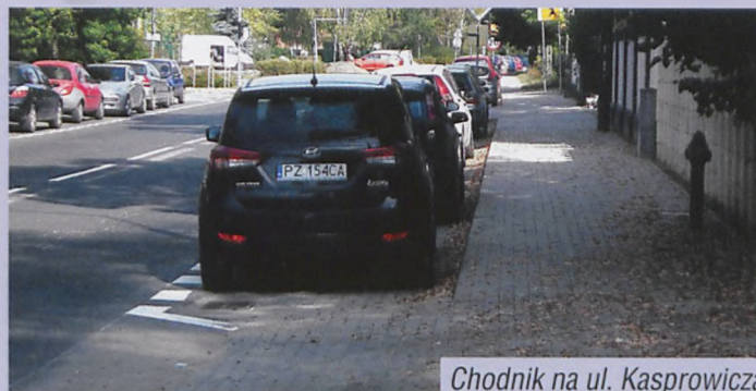
Chodnik na ul. Kasprowicza