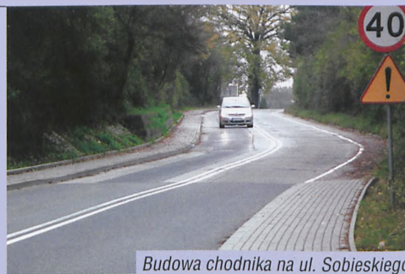
Budowa chodnika na ul. Sobieskiego