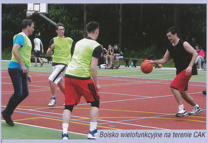
Boisko wielofunkcyjne na terenie CAK

wprowadzenie stypendiów sportowych organizacja lodowiska wyznaczenie wspólnie z WPN i sąsiednimi gminami oznakowanych tras (55 km) przeznaczonych do uprawiania nordic walking, biegania oraz narciarstwa biegowego