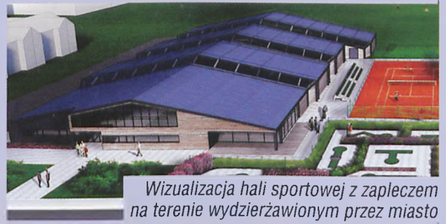
Wizualizacja hali sportowej z zapleczem na terenie wydzierżawionym przez miasto

wprowadzenie stypendiów sportowych organizacja lodowiska wyznaczenie wspólnie z WPN i sąsiednimi gminami oznakowanych tras (55 km) przeznaczonych do uprawiania nordic walking, biegania oraz narciarstwa biegowego