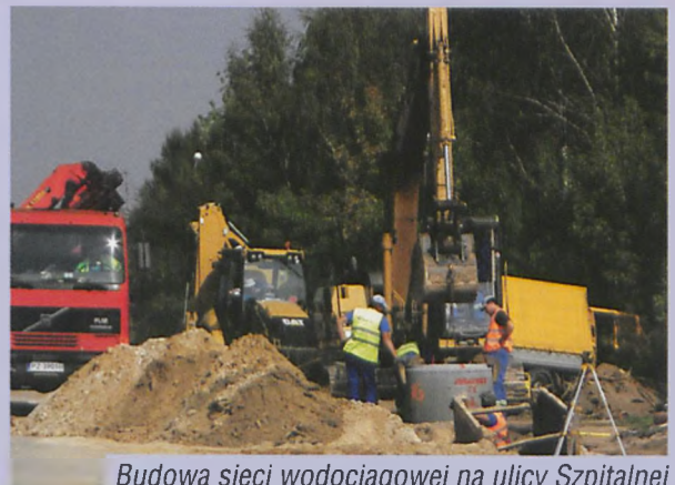
Budowa sieci wodociągowej na ulicy Szpitalnej