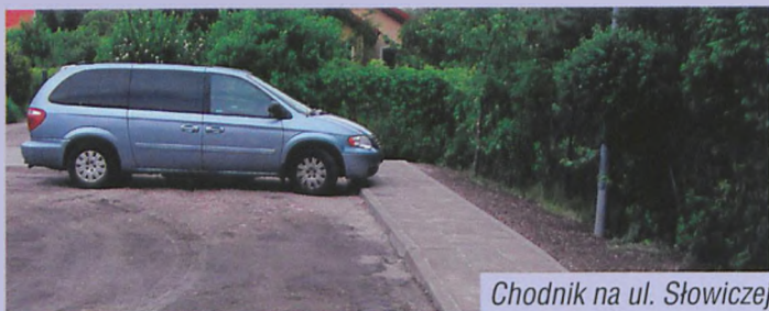
Chodnik na ul. Słowiczej