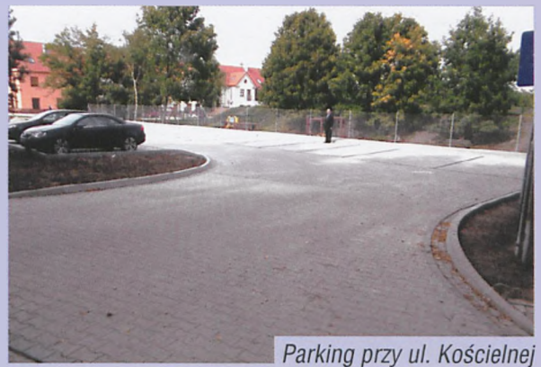
Parking przy ul. Kościelnej