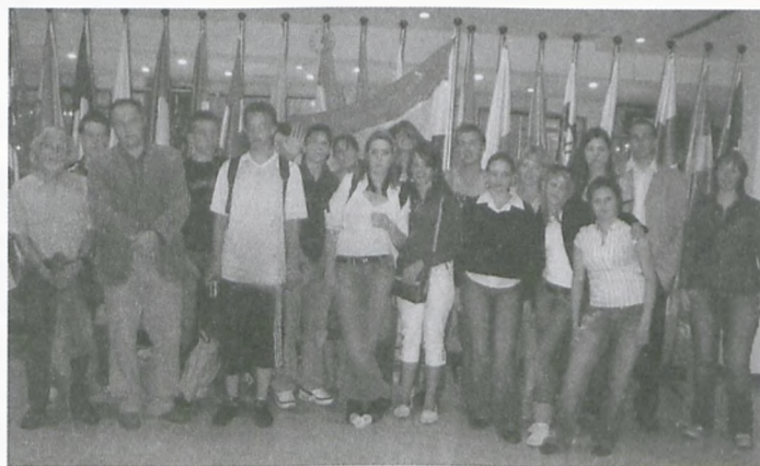
Młodzież z LO w Puszczykowie w Parlamencie Europejskim.