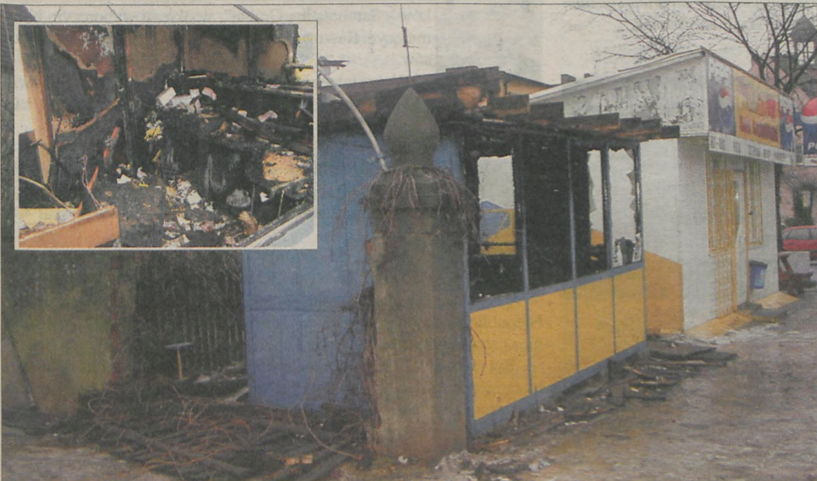
Kolektura totolotka znajdująca się na rogu ulic Paderewskiego i Sienkiewicza spaliła się doszczętnie