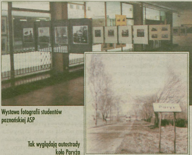
Wystawa fotografii studentów poznańskiej ASP

Prac jest tyle, że każdy z pewnością znajdzie coś dla siebie. Najbardziej przemawiają do mnie dwa cykle. Pierwszy, zatytułowany „Kim będę, gdy dorosnę” przedstawia fotografie dzieci. Autor poprosił maluchy, aby pokazały (miną, gestykulacją) swój wymarzony zawód, a także przedstawiły własny pogląd na sytuację w kraju. Przenosząc wzrok na kolejne zdjęcia, widzimy tytuły „Fatalnie”, „Andrzej Lepper” itp. Drugi cykl powstał w dość specyficzny sposób. W jednym z zaułków Ostrowa Wlkp. zatrzymywano przechodniów i na-