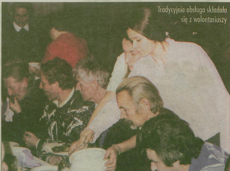
Tradycyjnie obsługa składała się z wolontariuszy

Potem, już po wieczerzy był gwiazdor, były prezenty i wspólne śpiewanie kołęd i rozmowy. I na koniec niektórzy mówili, że nie mogą się doczekać przyszłego roku i kolejnej wspólnej wigilii w JOK-u. (rp)