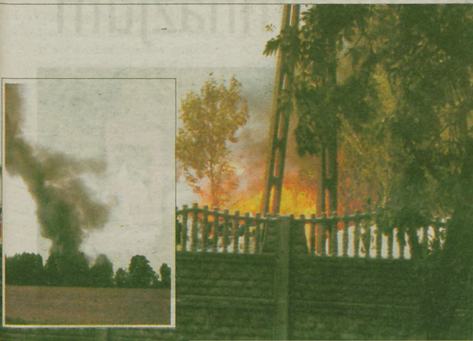
Rozmiar tragedii, która rozegrała się w Boguszynie, w żaden sposób nie oddawał obraz zgliszczy, który pozostał po Wielkopolskiej Korporacji - zakładzie utylizacji śmieci w Boguszynie