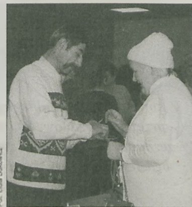
Bractwo charytatywne zaprosiło swoich podopiecznych - rodziny wielodzietne oraz osoby starsze i samotne na spotkanie opłatkowe do klasztoru ojców franciszkanów

duchową nad grupą charytatywną. Tradycyjnie dzielono się opłatkiem i składano sobie życzenia. Dla uczestników spotkania przygotowano również paczki świąteczne. Datki zebrane od parafian wystarczyły na przygotowanie 30 paczek. Dwadzieścia z nich otrzymały rodziny wielodzietne, a 10 - osoby starsze, samotne. Podobną akcję zorganizowała również parafia św. Marcina. W okresie przedświątecznym, dzięki hojności parafian 22 rodziny otrzymały wsparcie finansowe w wysokości 50 zł każda. Dodatkowo członkowie parafialnej akcji charytatywnej przygotowali 30 paczek żywnościowych.