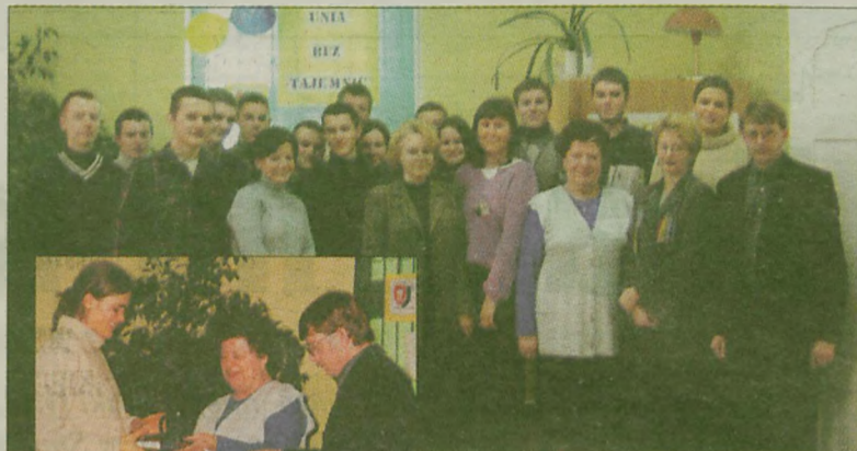
Uczestnicy konkursu wraz z komisją

Konkurs wiedzy o Unii Europejskiej dla uczniów Liceum Społecznego i Zespołu Szkół Ogólnokształcących odbył się z inicjatywy Ergo Hestia.