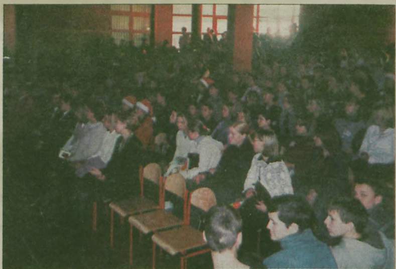
(akf) Publiczność obejrzała misterium, a później nuciła razem z aktorami kolędy