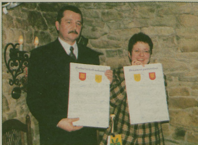
Gmina Jaraczewo zawarła porozumienie o współpracy ze Związkiem Niemieckich Gmin Regionu Köttschau