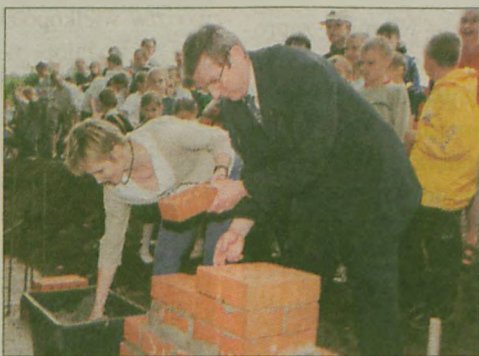
Do końca 2003 roku ma być oddana do użytku sala sportowo-widowiskowa przy Szkole Podstawowej nr 2 w Jarocinie. 31 maja wmurowano pod przyszły obiekt kamień węgielny