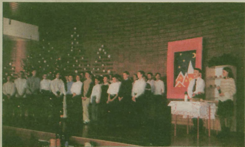
Świąteczne spotkania zorganizowała klasa I a żerkowskiego gimnazjum