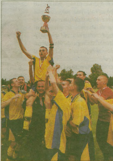
Jarocińscy piłkarze odnieśli największy w historii sukces. Jarota Jarocin wywalczyła Puchar Polski na szczeblu Wielkopolski. W finalowym meczu pokonała Amicę II Wronki 2:1