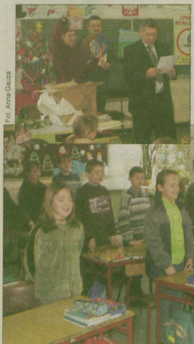
Akcję „Bezpieczniej z prądem” Energetyka Kaliska objęła około 30 szkół z terenu południowej Wielkopolski

Ogólnopolską akcję „Bezpieczniej z prądem” zainicjowało Polskie Towarzystwo Przemysłu i Rozdziału Energii Elektrycznej. Włączyła się w nią również Energetyka Kaliska S.A. Program skierowany jest do najmłodszych dzieci. Akcję informacyjną w szkołach podstawowych na terenie działania Energetyki Kaliskiej przeprowadzają pracownicy rejonowych zakładów energetycznych.