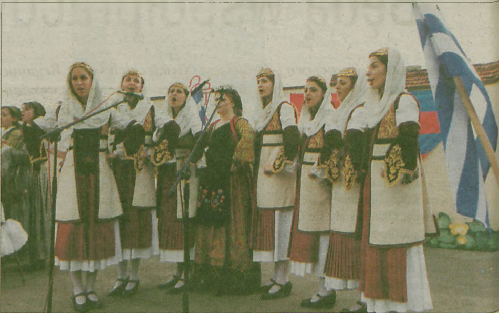
Przez kilka dni w Jarocinie rozbrzmiewała muzyka ludowa z różnych stron Europy. Podczas V Międzynarodowych Spotkań Folklorystycznych można było usłyszeć rzadko spotykane instrumenty i niemal egzotyyczną muzykę