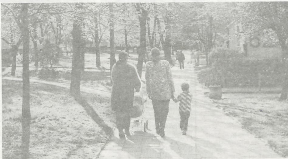
Wiosna pora spacerów.